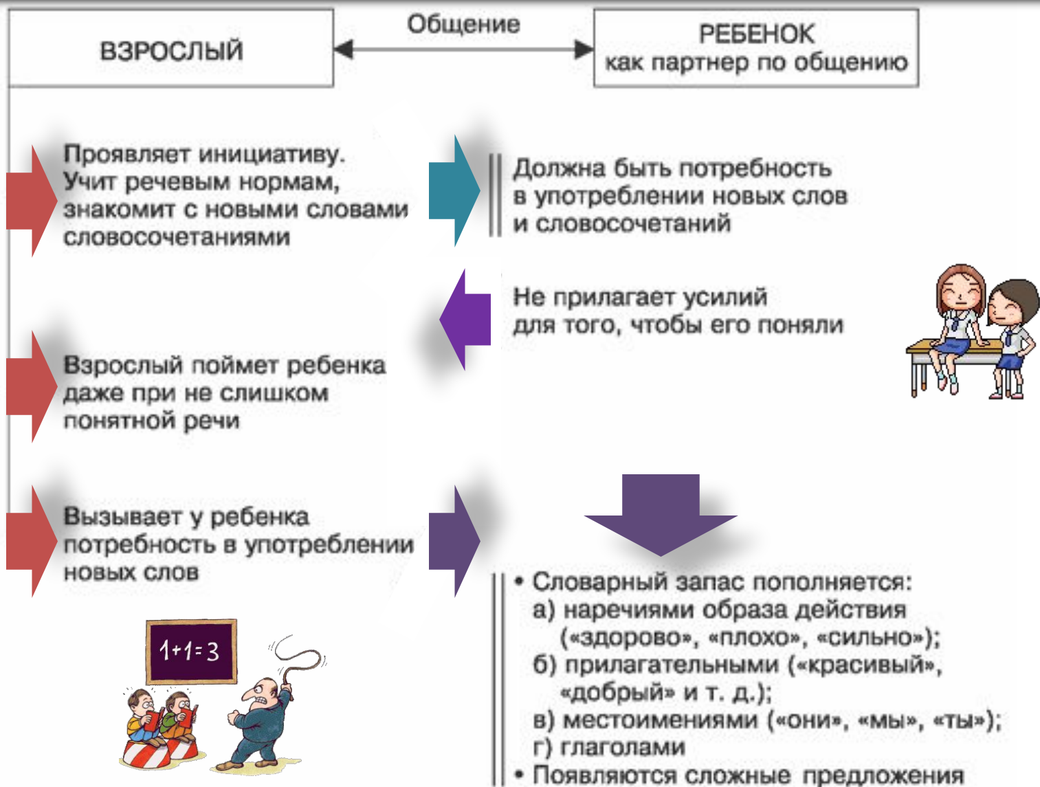
Рис. 9.10. Взрослый, по сравнению с детьми, — более понятный и чуткий партнер по общению