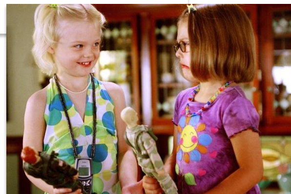
Рис. 9.9. Дети учат друг друга разговаривать

Совместные игры, деятельность побуждают к развитию словарного запаса речи