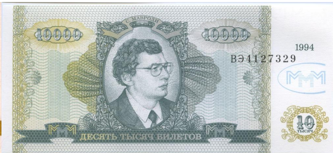
Билеты МММ — денежные суррогаты акционерного общества МММ, введенные в обращение в 94-ом году.