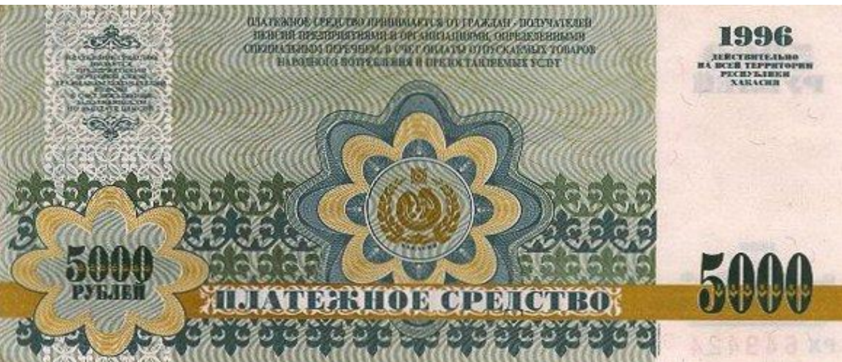
Хакасский рубль. Платёжное средство Совета Министров Республики Хакасия, введенное в оборот в 90-ые годы.

В условиях, когда в 1990-е гг. в России наличная денежная масса была искусственно занижена, но при этом составляла более 35% от общего объема денежных средств в обращении, безналичные средства платежа, выраженные в рублях, использовались крайне слабо, а электронные деньги не использовались вообще, произошел возврат к многовалютной системе, существовавшей в дореволюционной централизованной экономике. Место многих типов рублей заняли многие типы денежных суррогатов, что привело к нарушению одного из фундаментальных принципов МВФ — «одна страна — одна валюта».