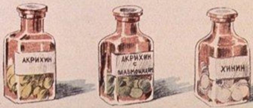
ЛЕКАРСТВА, КОТОРЫЕ ПРИМЕНЯЮТСЯ ДЛЯ ЛЕЧЕНИЯ МАЛЯРИИ.

Обращайтесь к врачу в начале болезни. Точно выполняйте все его назначения и указания. Правильное лечение обеспечивает скорейшее и полное выздоровление от малярии.