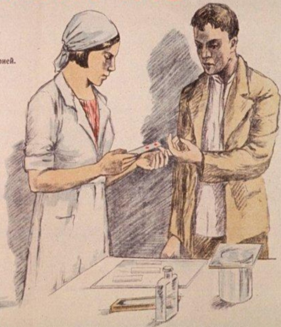
ИССЛЕДОВАНИЕ КРОВИ У БОЛЬНОГО МАЛЯРИЕЙ.