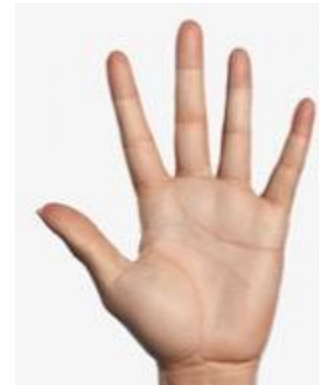
Часть руки от запястья до конца пальцев