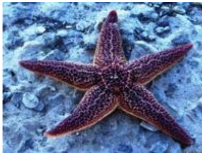
Название животных и растений, похожих по форме на звезды (морская звезда)