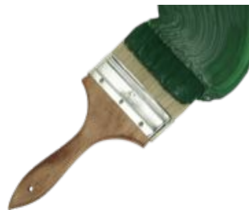
Пучок щетины, волос на рукоятке для нанесения краски, клея