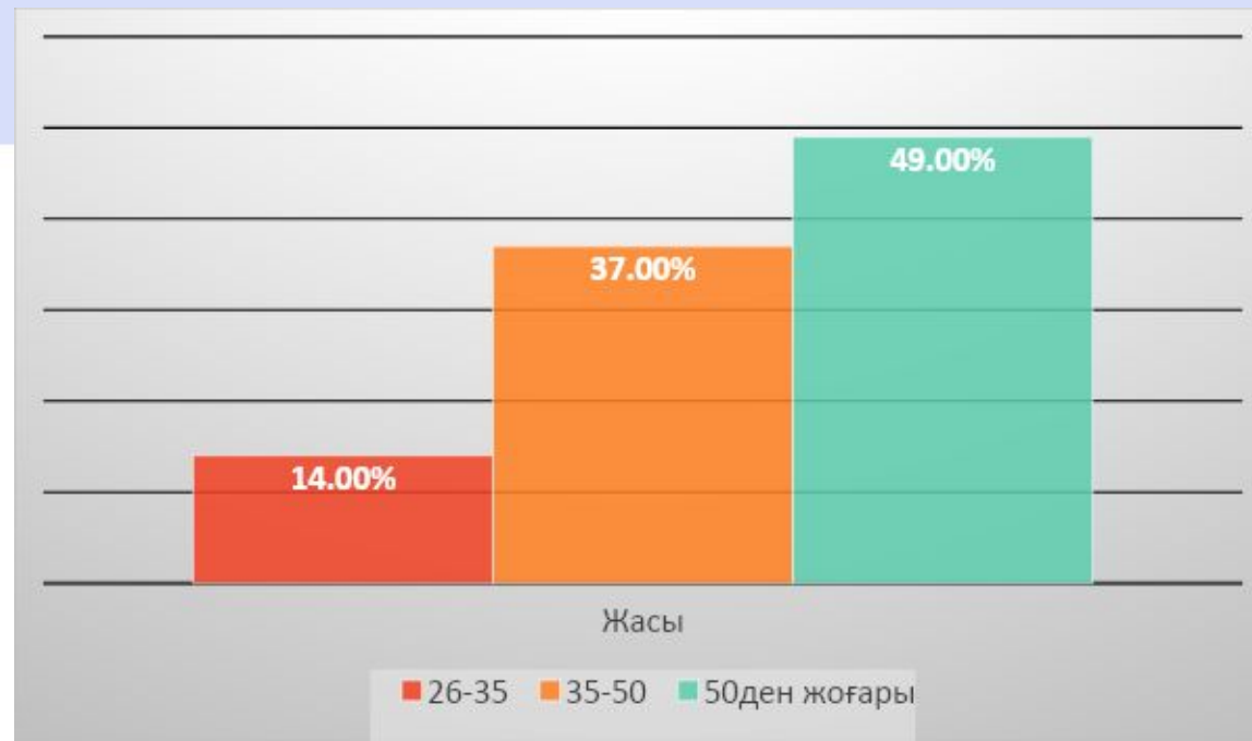
2.3 сурет. Менеджер-респонденттердің білімі және жас ерекшеліктері