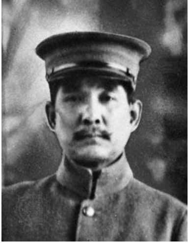
ЛИДЕР РЕВОЛЮЦИИ — СУНЬ ЯТСЕН