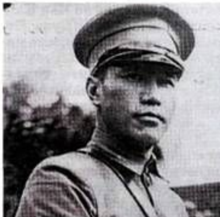
ЛИДЕР ГОМИНЬДАН ЧАН КАЙШИ