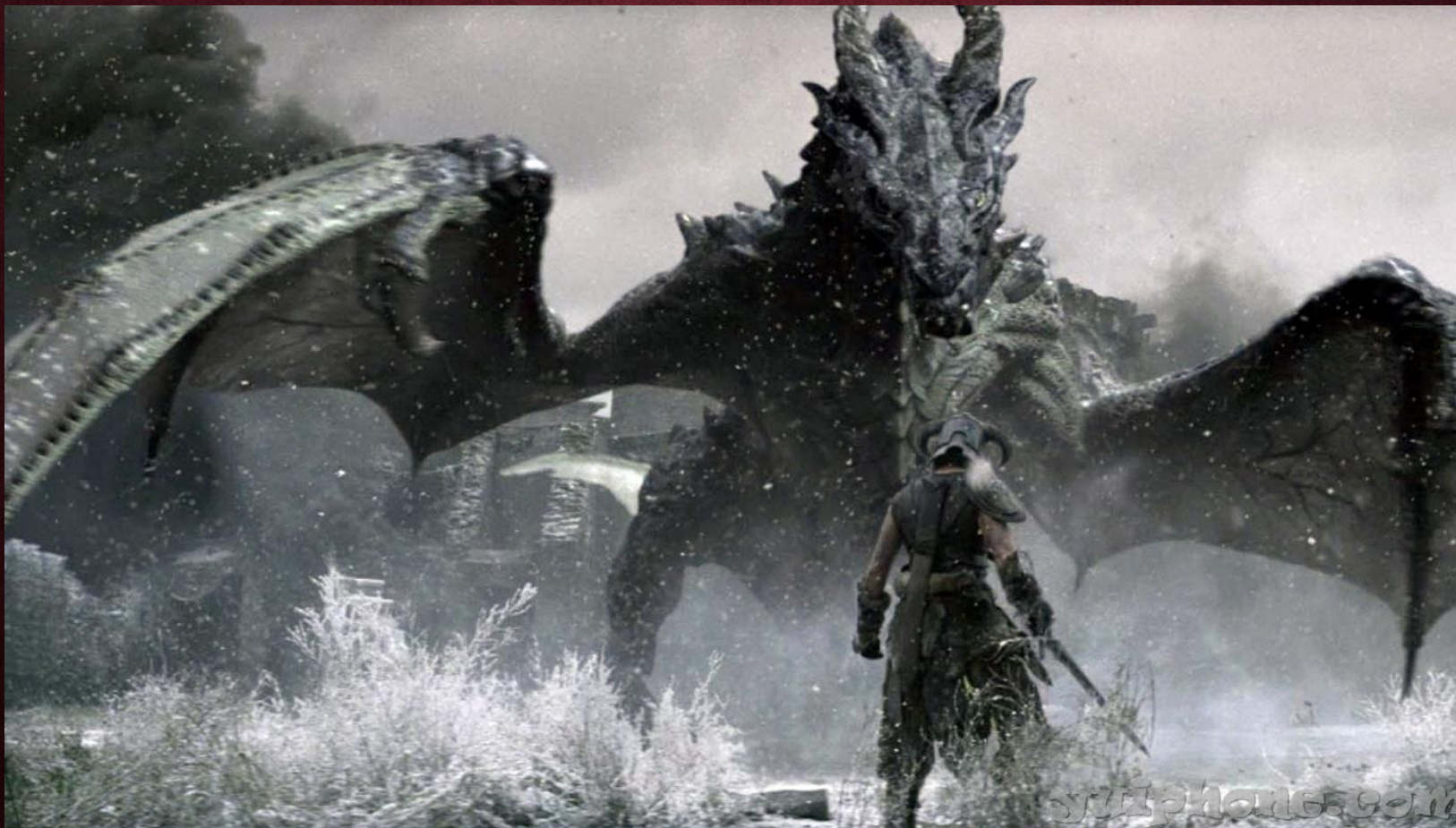
The Elder Scrolls