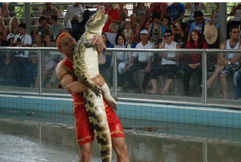
Дрессировщики хищных животных