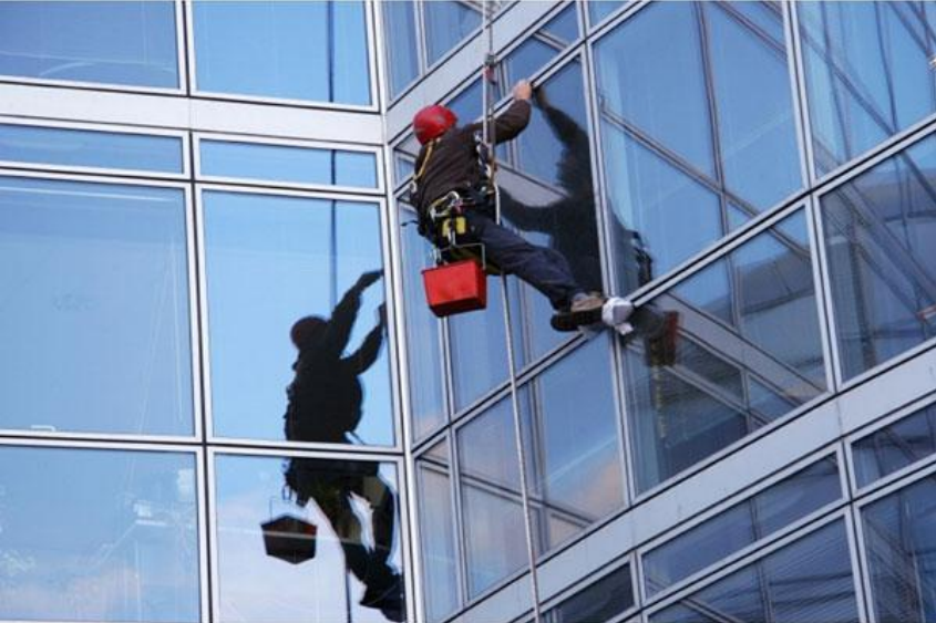
Мойщики окон небоскребов