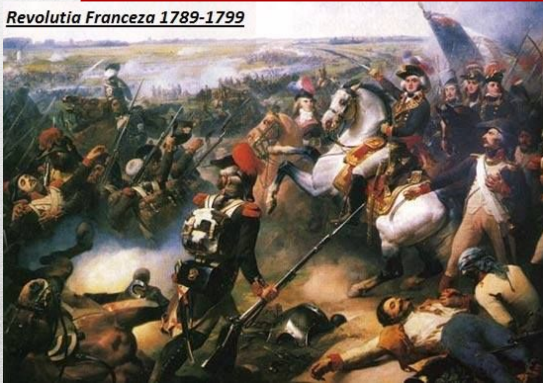
Revoluția Franceză 1789-1799

In anii 1788-1789 Franța a fost lovită de o criză economică puternică, ani cu roada scăzută, decaderea meseriilor, creșterea prețurilor, a datoriei de stat la 4.5 miliarde franci.