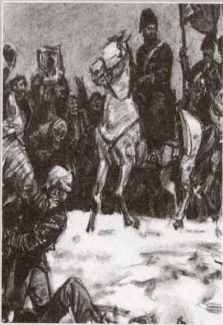
На коне Пугачёв

В 1773 году возглавил восстание крестьян на Яике, провозгласив себя чудом спасшимся императором Петром III.