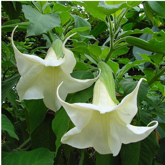
А) дурман – трава

Какая трава, если ей владеть и носить при себе, заставляет всех повторять движения хозяина травы? Например: Я – владелец этой травы – перекувыркнусь и все тотчас же будут кувыркатся?!