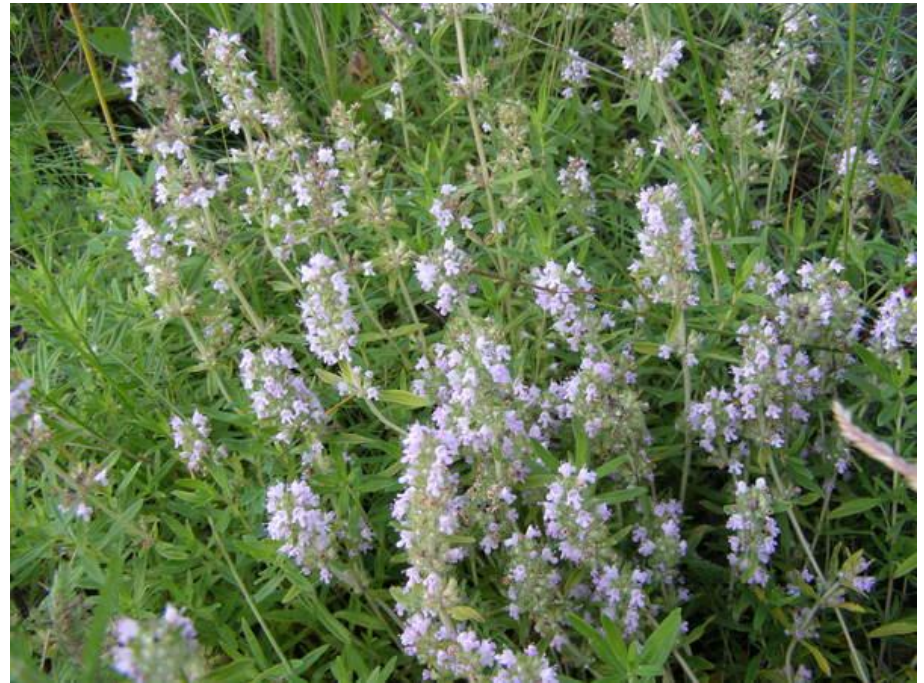
Чабрец, богородская трава