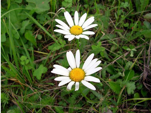
А) поповник обыкновенный

Какую траву надо иметь в кармане, чтобы быть отличным охотником и стрелком?