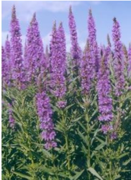
Б) плакун – трава