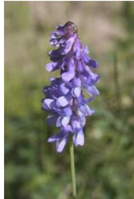
Зяблица, мышинный или воробьиный горошек