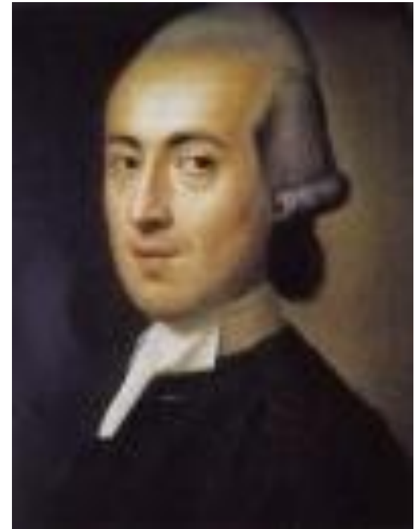
ИОГАНН ГЕРДЕР 25.08.1744 – 00.00.1803