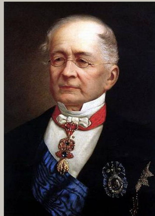
А. М. Горчаков

Во главе Министерства иностранных дел был поставлен князь А. М. Горчаков. В письме Александру II он так определил основную внешнеполитическую цель страны: «При современном положении нашего государства и Европы вообще главное внимание России должно быть упорно направлено на осуществление дела нашего внутреннего развития, и вся внешняя политика должна быть подчинена