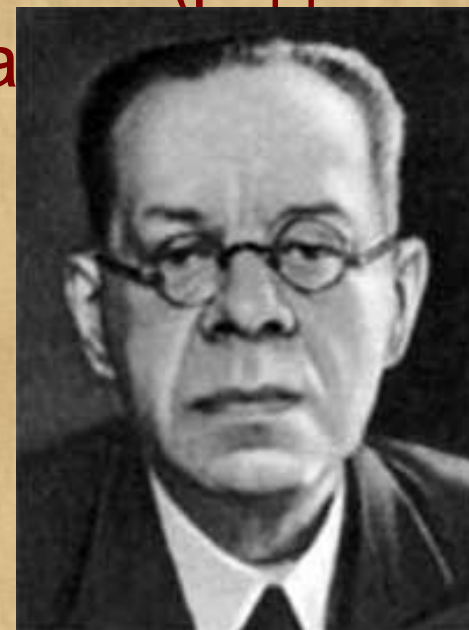
редактор М. Лозинский