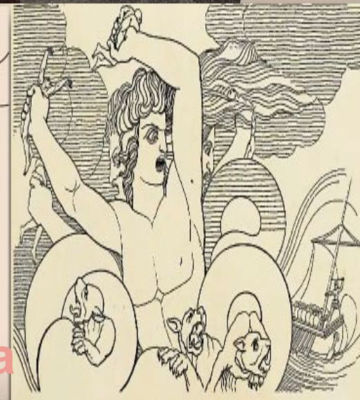
Сцилла и Харибда