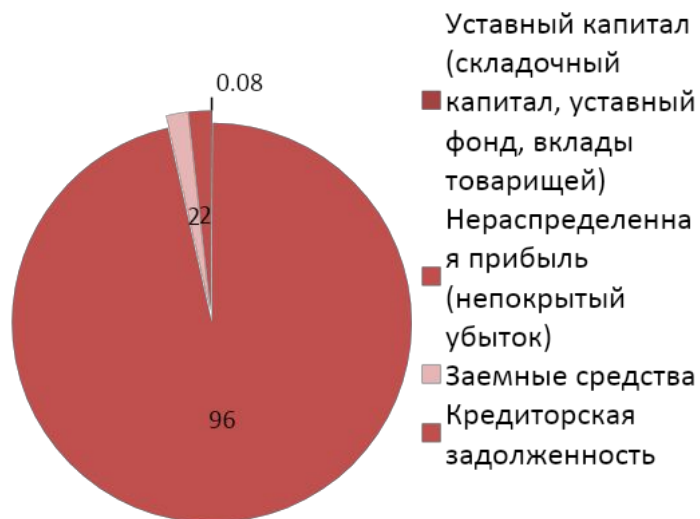
Структура пассивов, %

Источники формирования имущества организации в 2021 г. распределились следующим образом: