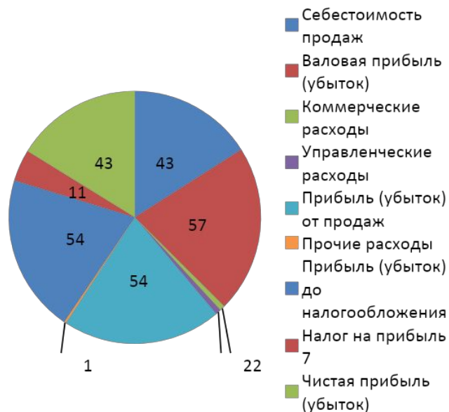
Структура доходов и расходов в выручке в 2021г., %

В 2021 г. наибольший удельный вес по отношению к выручке имеет валовая прибыль (57%). Это положительно характеризует деятельность организации, т.к. наибольший доход приносит основной вид деятельности.