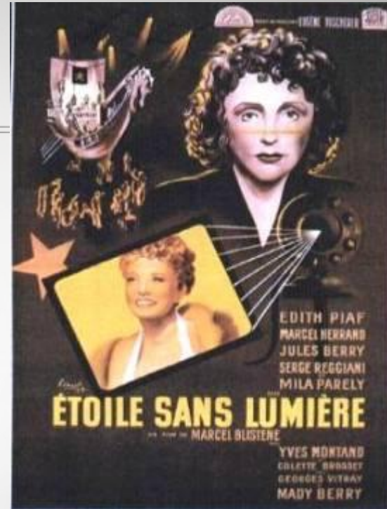
«Étoile sans lumière»