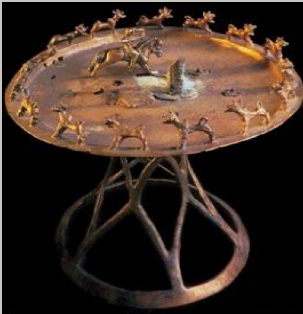
Съетильник со всадником, III—II вв. до н. э. (Алматы)