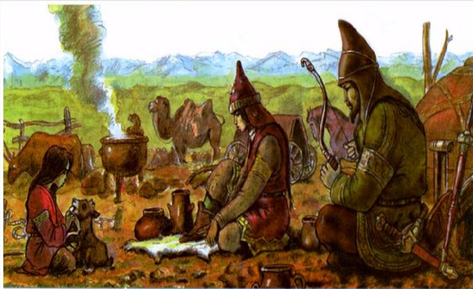
Повседневная жизнь саков.