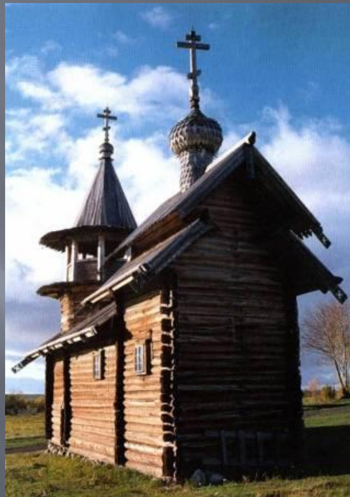
Часовня Михаила Архангела