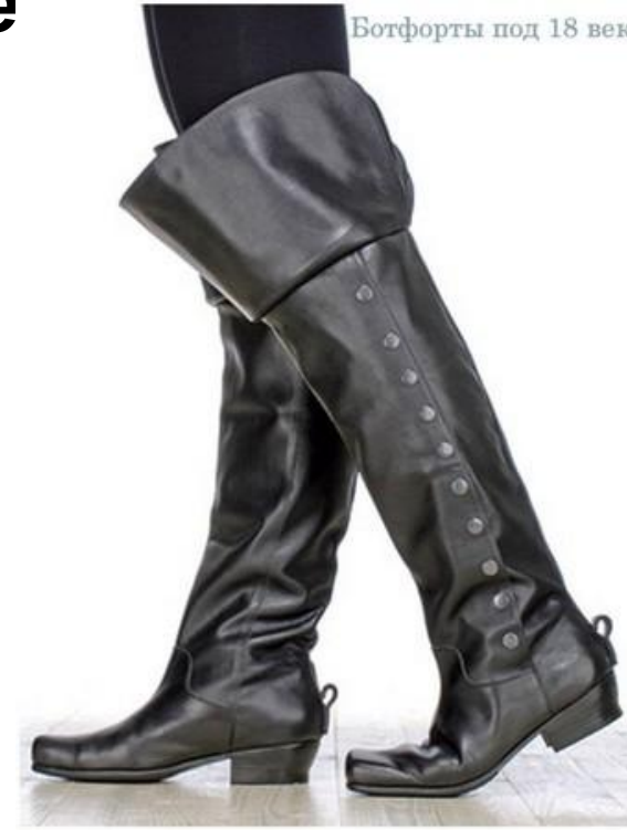
Ботфорты под 18 век

• Во второй половине XVII века дворяне стали носить обувь белого либо черного цвета на высоких, достигавших 7 сантиметров, красных каблуках и толстых пробковых подошвах, обтянутых красной кожей. Предполагают, что моду на такую обувь ввел Людовик XIV, отличавшийся небольшим ростом. Туфли украшали узким бантом на подъеме и шелковой розеткой на носке. Для охоты надевали высокие сапоги с раструбами— ботфорты.