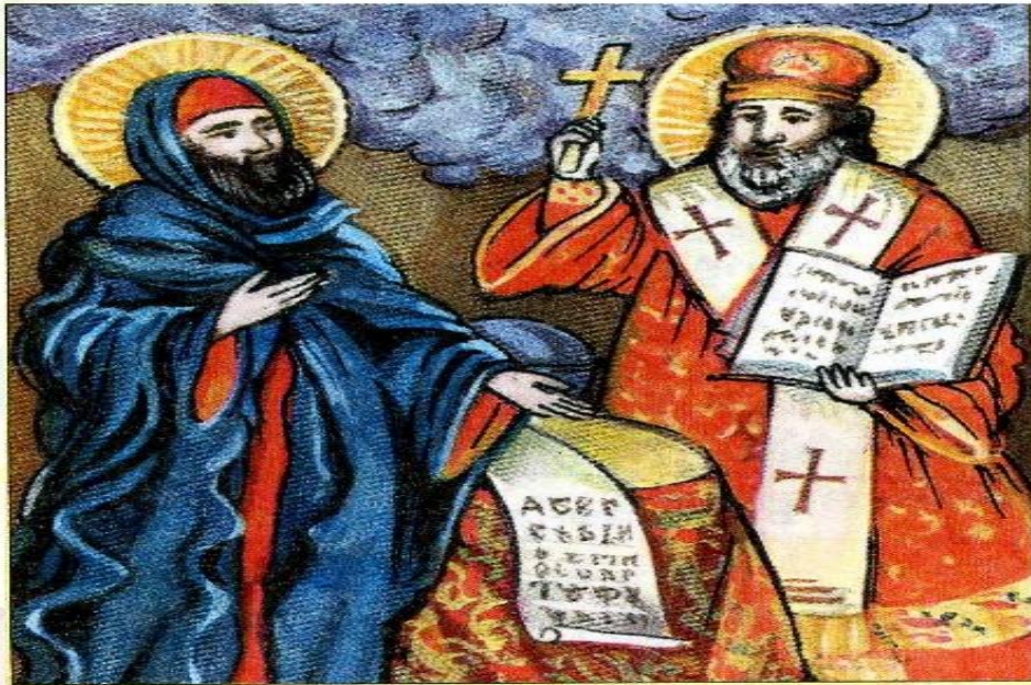
Кирилл и Мефодий

О существовании у восточных славян письменности в дохристианский период свидетельствуют многочисленные письменные источники и археологические находки. Создание славянской азбуки связывают с именами византийских монахов Кирилла и Мефодия. Кириллом во второй половине IX века был создан глаголический алфавит (глаголица), на котором были написаны первые переводы церковных книг для славянского населения Моравии и Паннонии. На рубеже IX-X веков на территории Первого Болгарского царства в результате синтеза издавна распространенного здесь греческого письма и тех элементов глаголицы, которые удачно передавали особенности славянских языков, возникла азбука, получившая позднее название кириллица. В дальнейшем этот более легкий и удобный алфавит вытеснил глаголицу и стал единственным у южных и восточных славян.