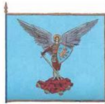
Прапор Українських січових стрільців