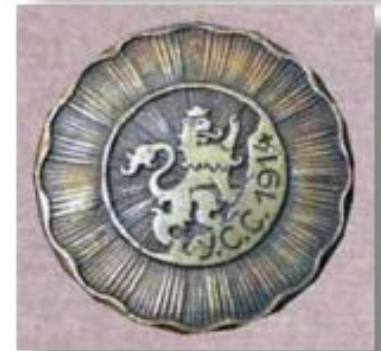
Відзнака Українських січових стрільців. 1914–1918 рр.