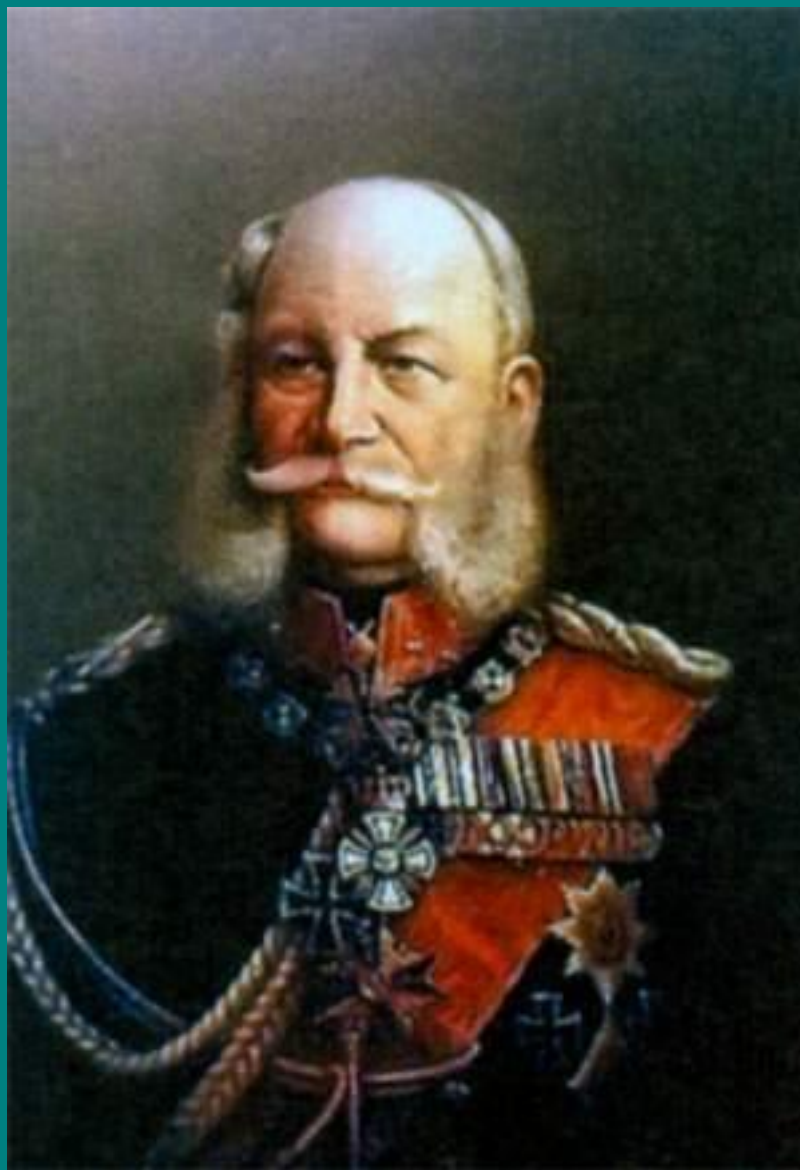
Вільгельм I Гогенцоллерн (1797-1888)