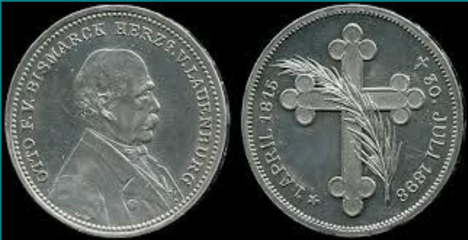
Пам'ятна монета із зображенням Бісмарка (1916 р.)