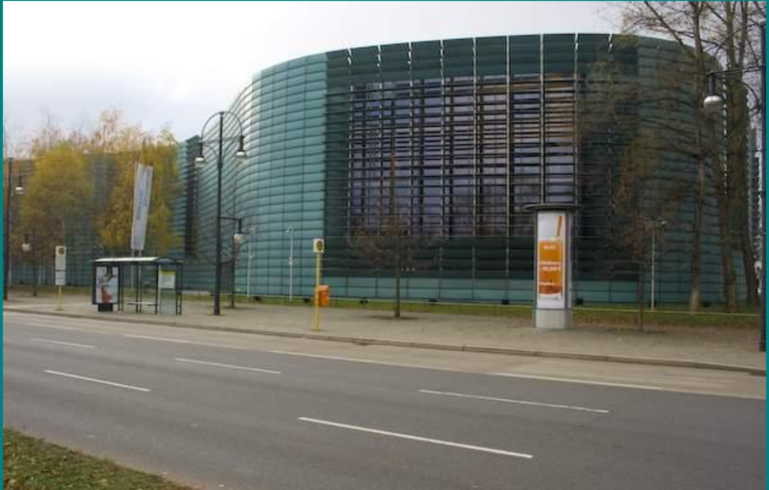
Будівля Північних Посольств у Берліні