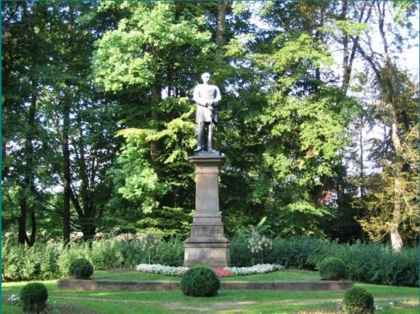
Пам'ятник Бісмарку в Любеку