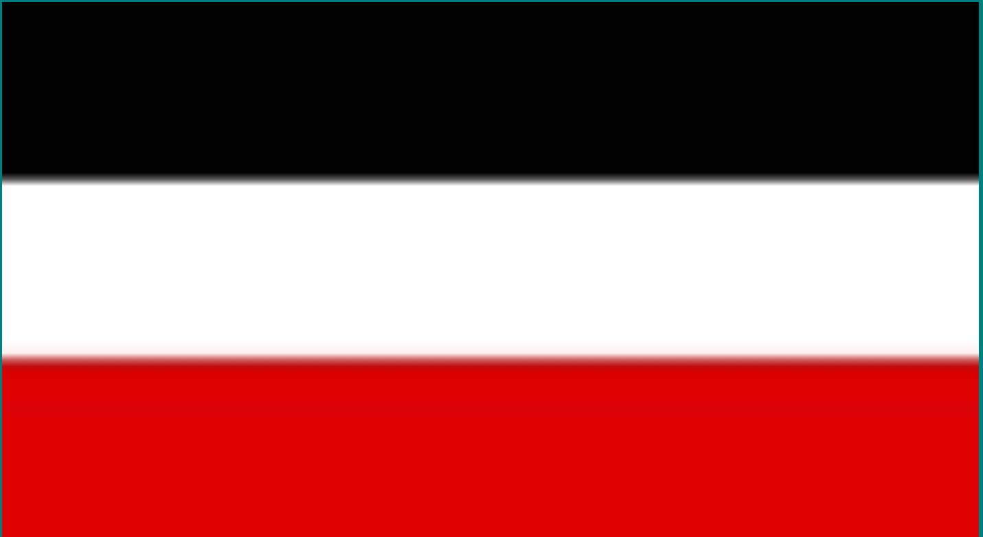
Прапор Північнонімецького союзу (1866-1871 рр.)