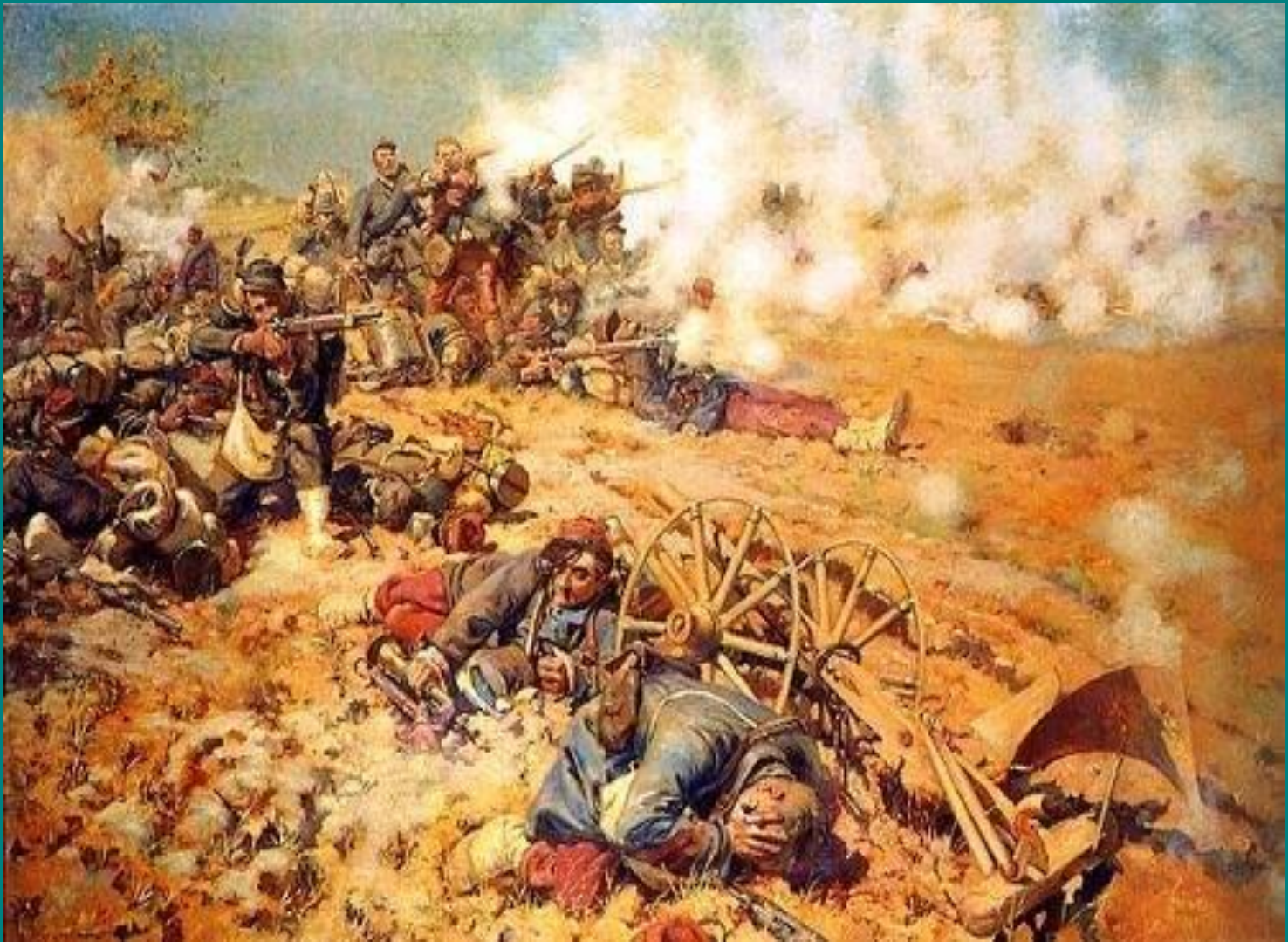
Франко-пруссська війна. Бій під Марс-ла-Туром. 1870 р.