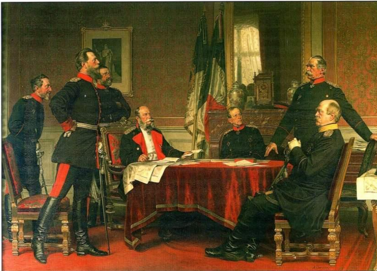
Німецька штаб-квартира у Версалі. 1871 рік.