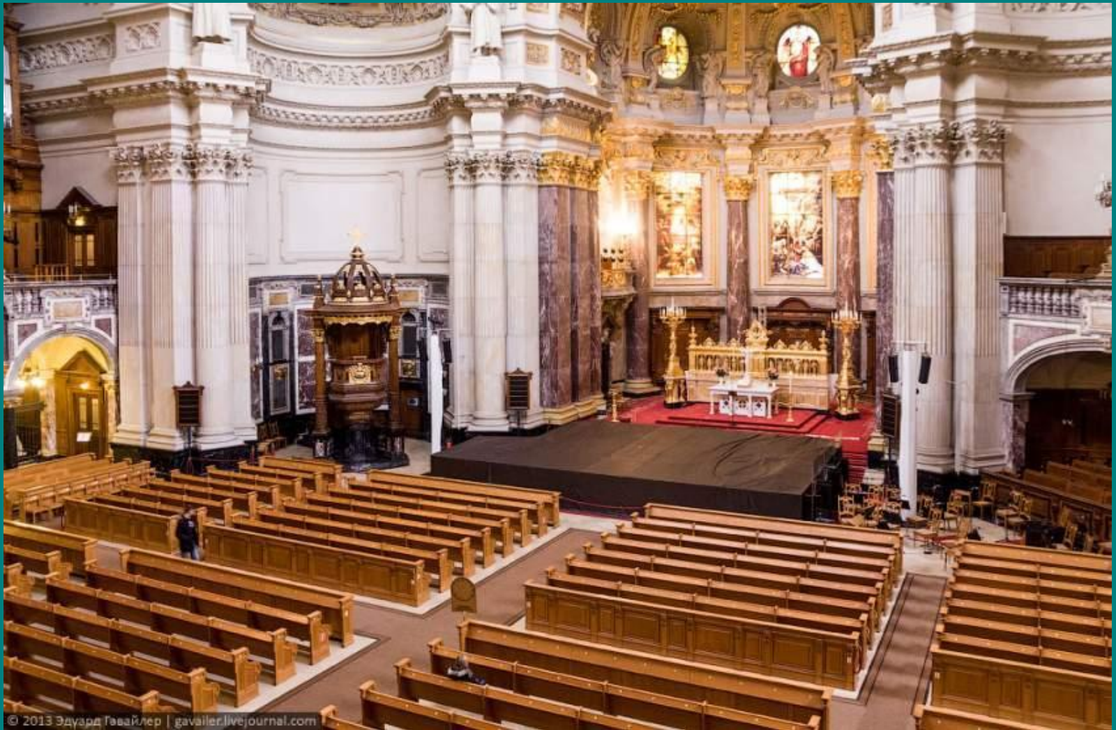
Кафедральный собор (внутрішній вигляд)