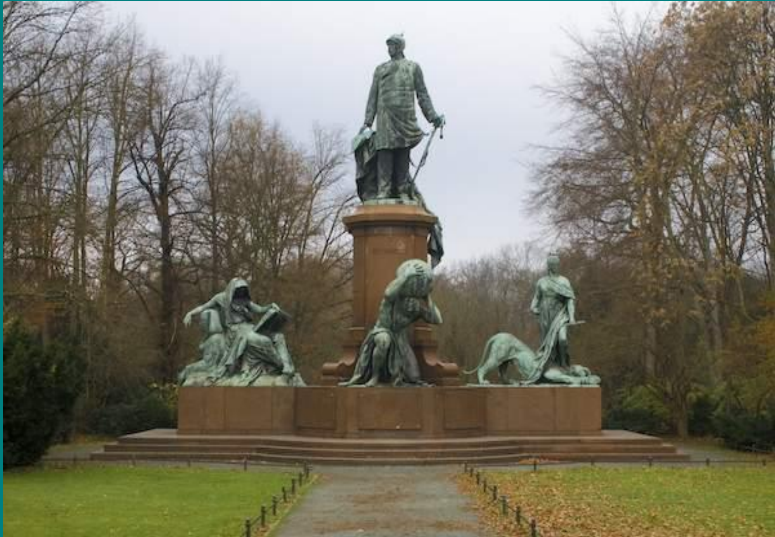
Меморіал Бісмарку в Берліні