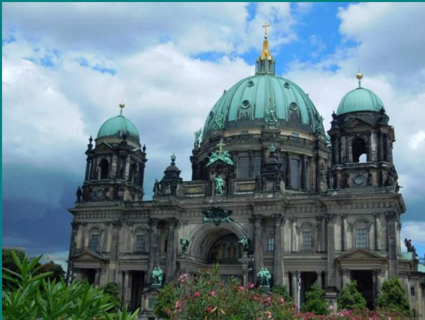
Кафедральный собор (1894)