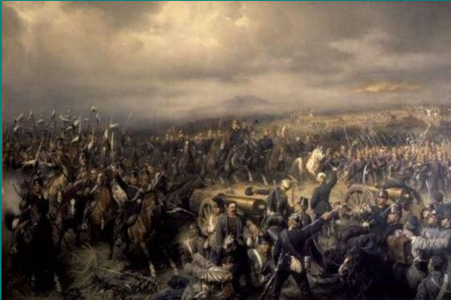
Бій під Кеніггретцем. 1866 р.