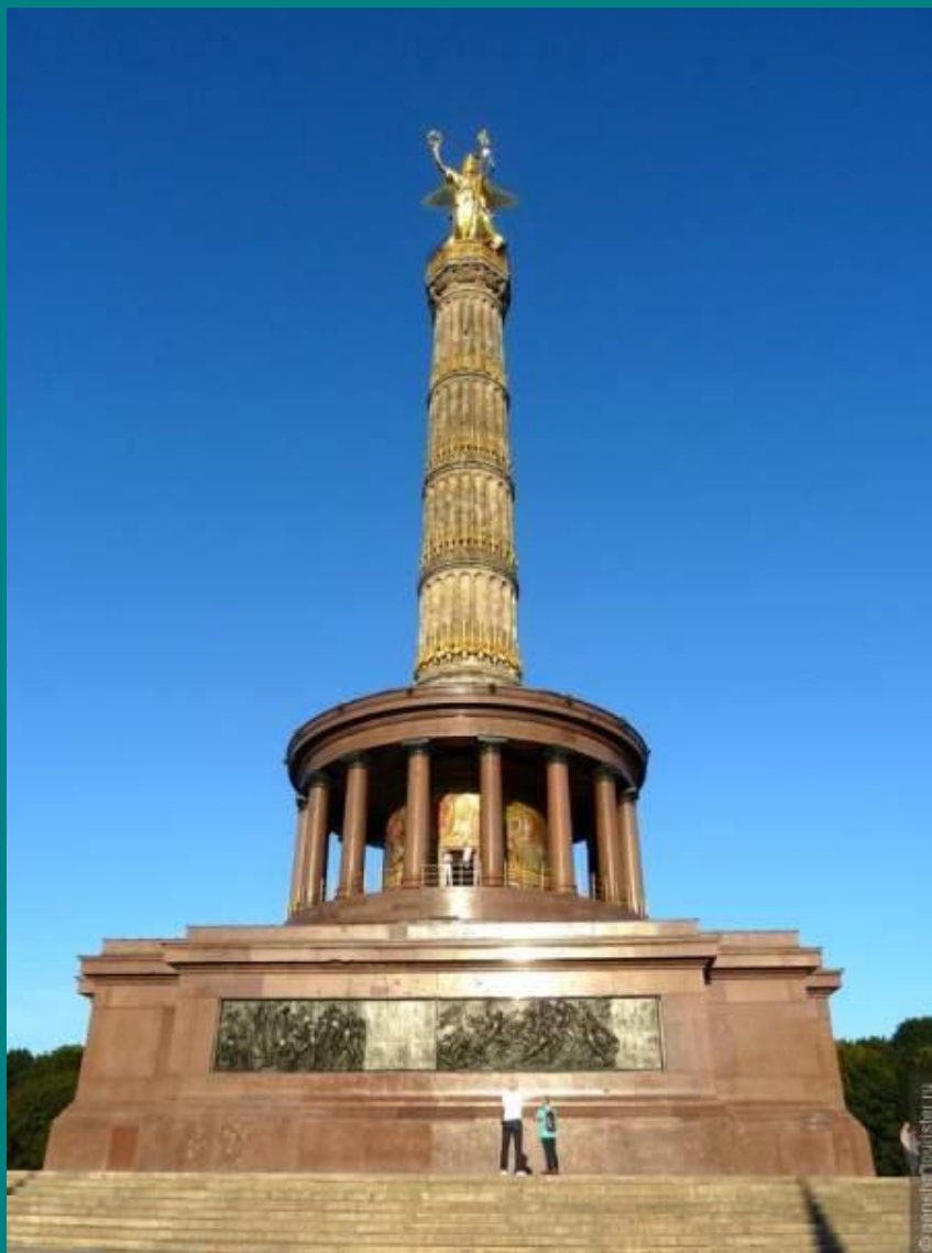
Колона Перемоги у Берліні (1873)