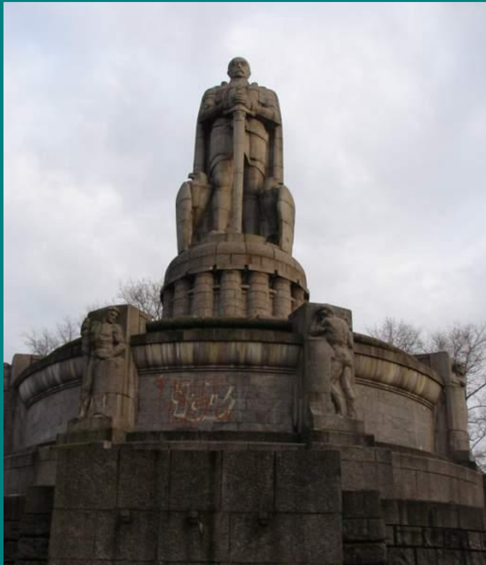
Пам'ятник Бісмарку у Гамбурзі