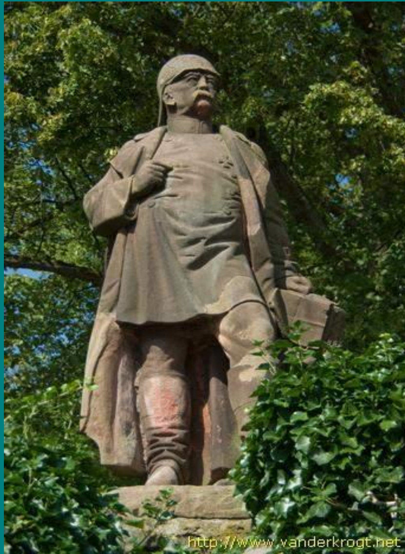
Пам'ятник Бісмарку в Бремені