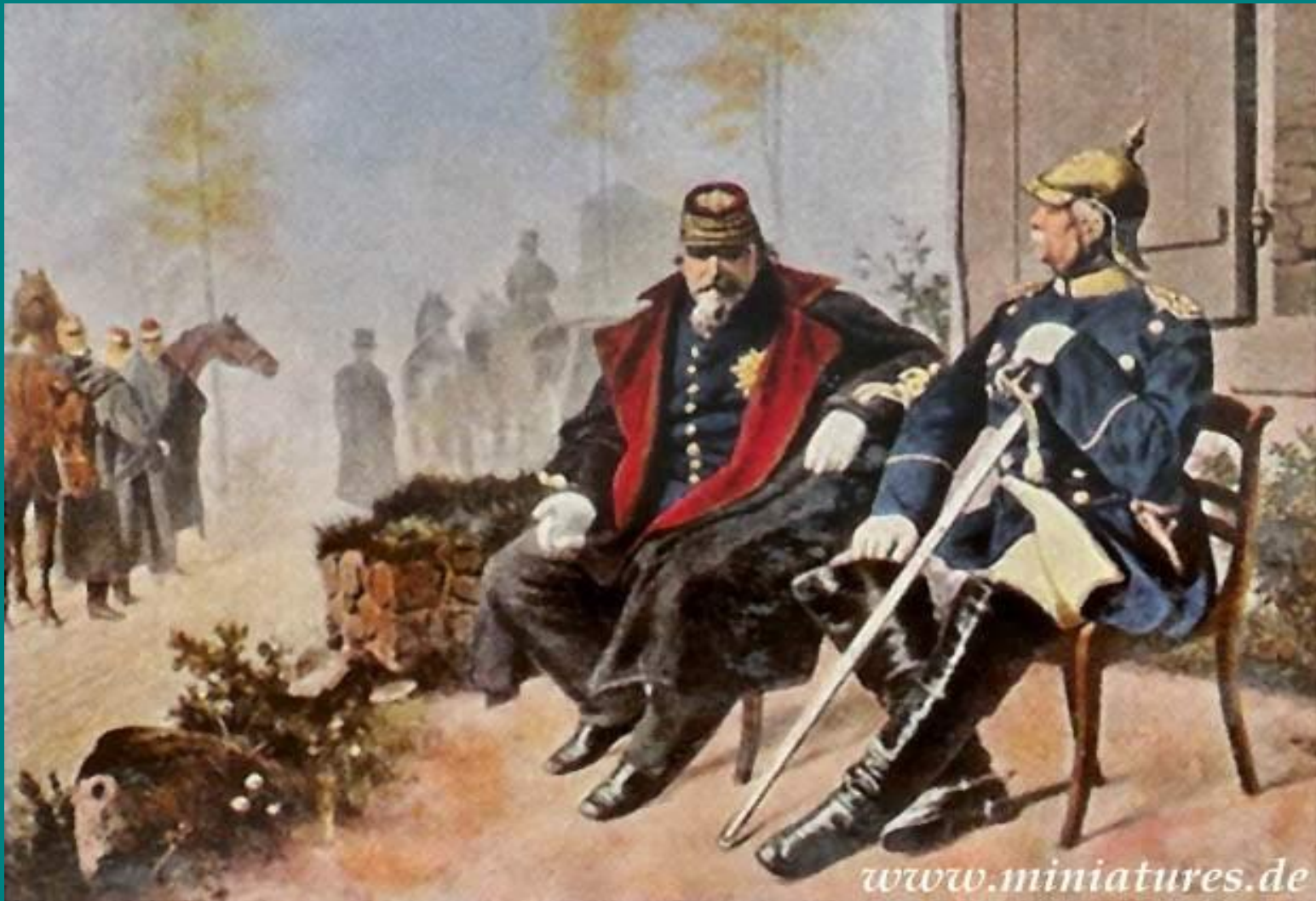
Бісмарк розмовляє з полоненим Наполеоном III. 1870 рік