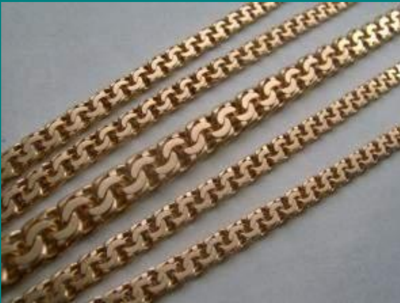
Плетіння ланцюжка “Бісмарк”