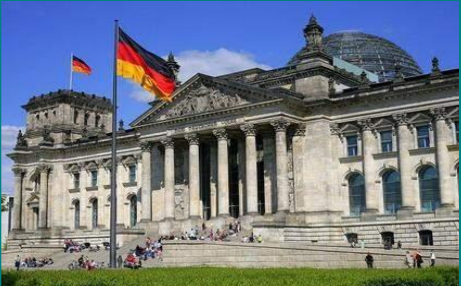
Рейхстаг (1884-1894). Архітектор Пауль Валлот