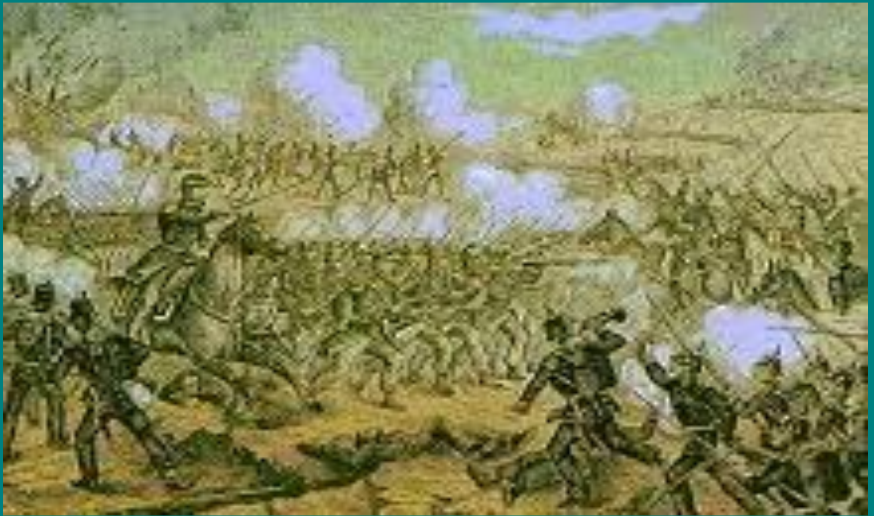
Франко-пруссська війна. Бій під Седаном 1870 р.