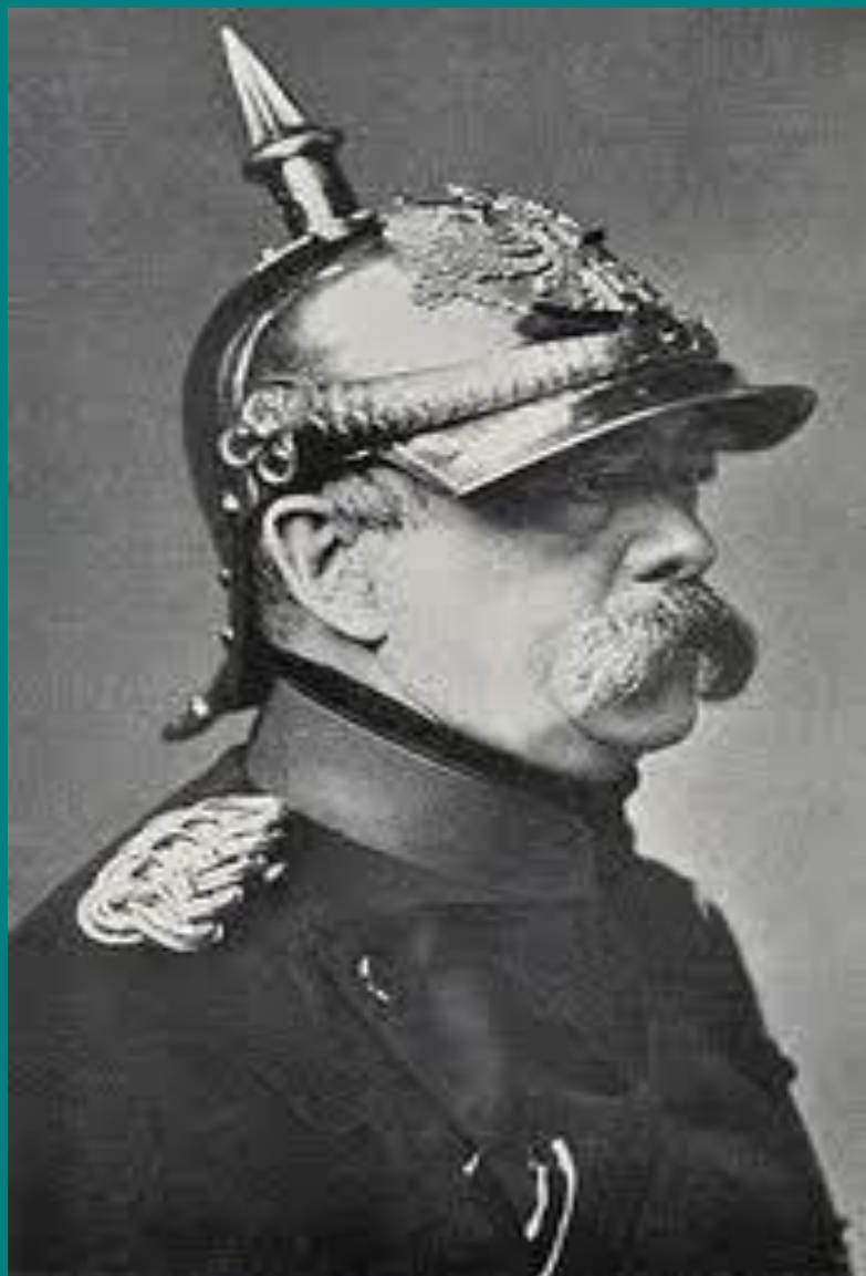
Отто фон Бісмарк – канцлер Німеччини (1862-1890)