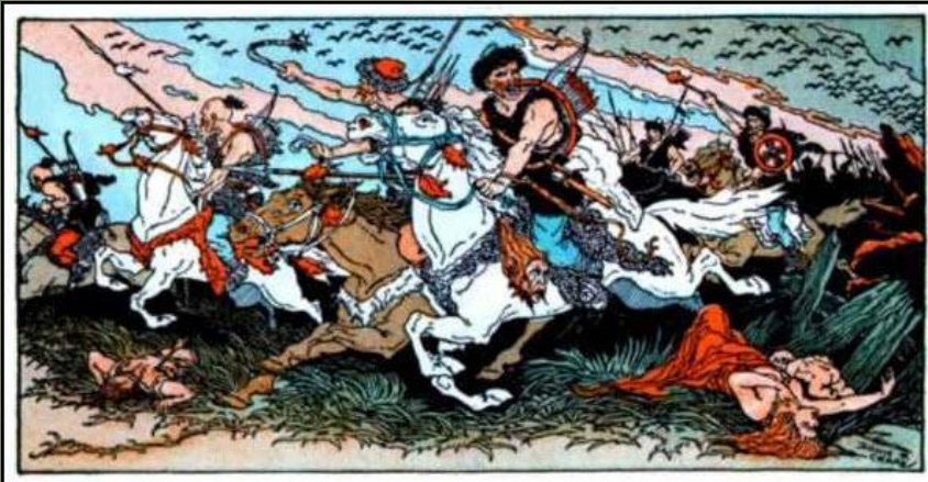
Гунны. Современный рисунок