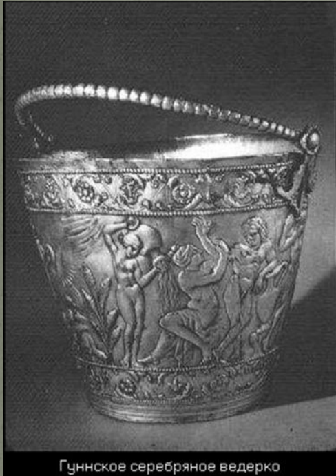
Гуннское серебряное ведро

Сегодня археологи определяют гуннские памятники и их ареал с помощью нанесения на карту тех категорий вещей, которые непосредственно связаны с гуннами. Это бронзовые котлы, бронзовые китайские зеркала, специфически гуннские г-образные удила, элементы сложного лука, седла, трехлопастные наконечники стрел, диадемы.