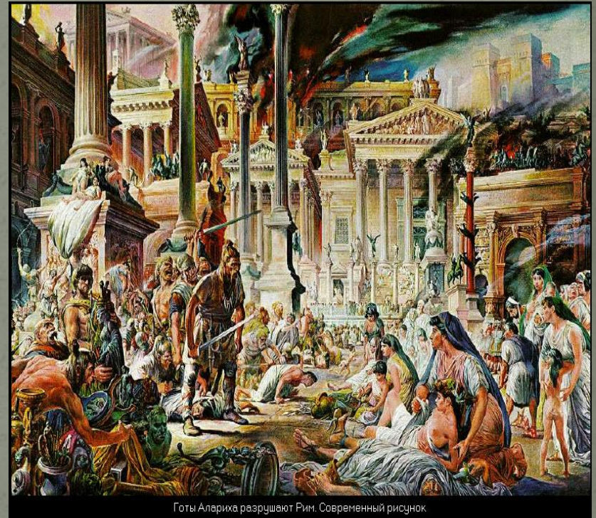
Готы Алариха разрушают Рим. Современный рисунок