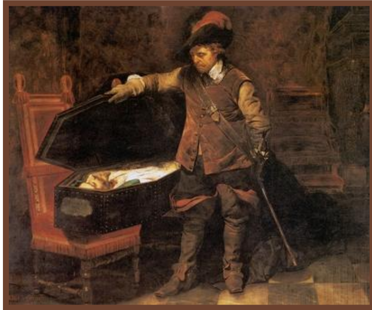
Кромвель у гроба Карла I

Включает все - от производства до духовной культуры.