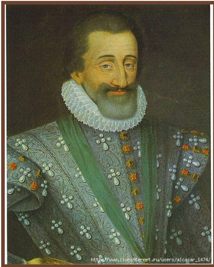
Генрих IV Наваррский

Пресвитеры. «Бог в душе». «Дешевая церковь».