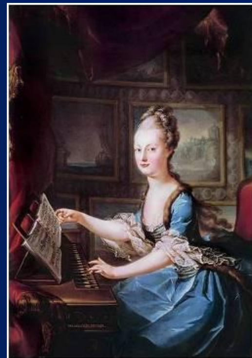
Мария-Антуанетта (1755 – 1793)

«Июнь. 20-е – охота на оленя в 9 часов в Бютар, застрелил одного. 22-е – ничего. 25-е – ничего, охота на оленя в Сент-Аполлин. 30-е – ничего».