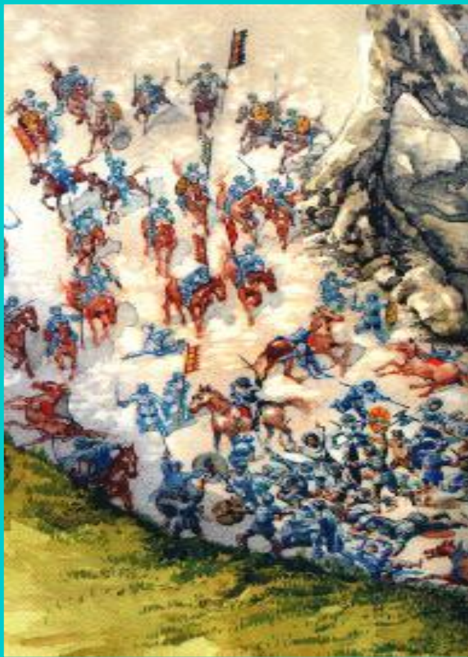
Сражение в Ронсевальском ущелье.