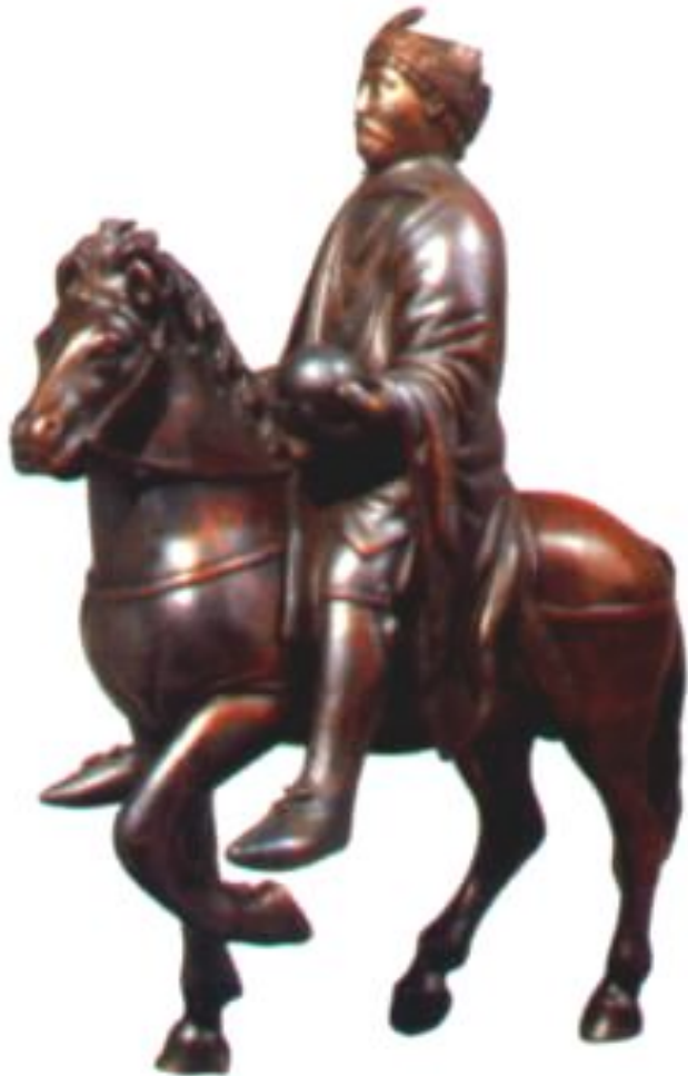
Карл Великий в походе. Статуэтка из Лувра.