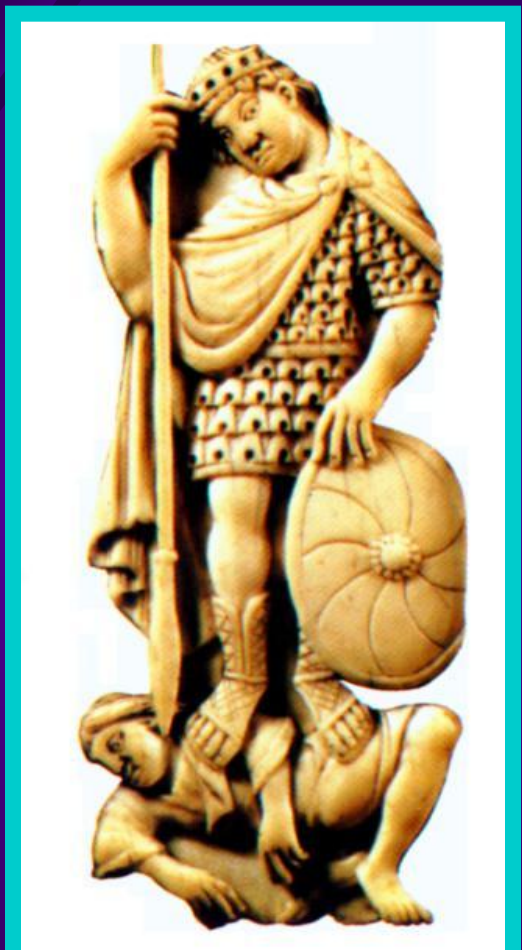
Фибула. Франк поражающий сакса.