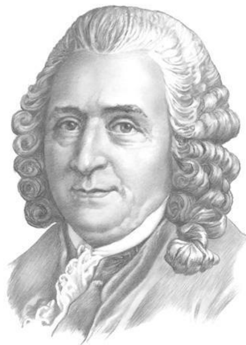
Карл Линней 1707—1778