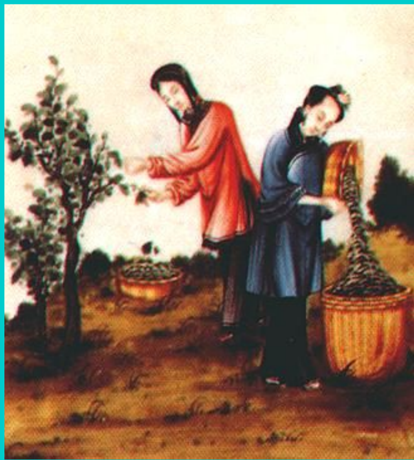
Крестьяне за сборкой тутового червя. * Миниатюра 13 в.

В 874 г. на северо-востоке страны началось восстание под предводительством Хуан Чао. Крестьяне прошли с севера на юг и заняли Гуанчжоу и подошли к столице-Чаньяню. Заняв город, Хуан Чао провозгласил себя императором, отменил налоги, раздал имущество знати беднякам. прежний император пригласил кочевников с севера и в 884 г. повстанцы были разбиты.