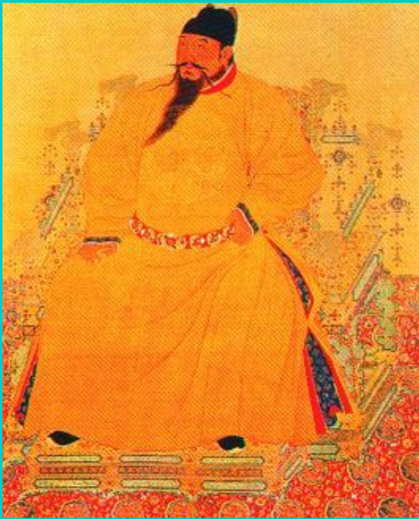
Чэн-цзу. Император *династии Мин(н.15 в.)

В сер.14 в.восстание красных повязок.Его основу составили крестьяне, их поддержали жители городов.Восставшие заняли столицу и начали теснить завоевателей к границам.В 1386 г. Последний монгольский император бежал на север.В Китае установилась династия Мин и в стране начался экономический и культурный подъем.