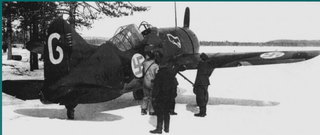
Финский истребитель на аэродроме. 1939

30 ноября 1939 – вторжение советских войск в Финляндию