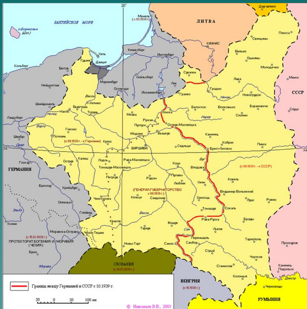
Раздел Польши между Германией и СССР в 1939. Карта