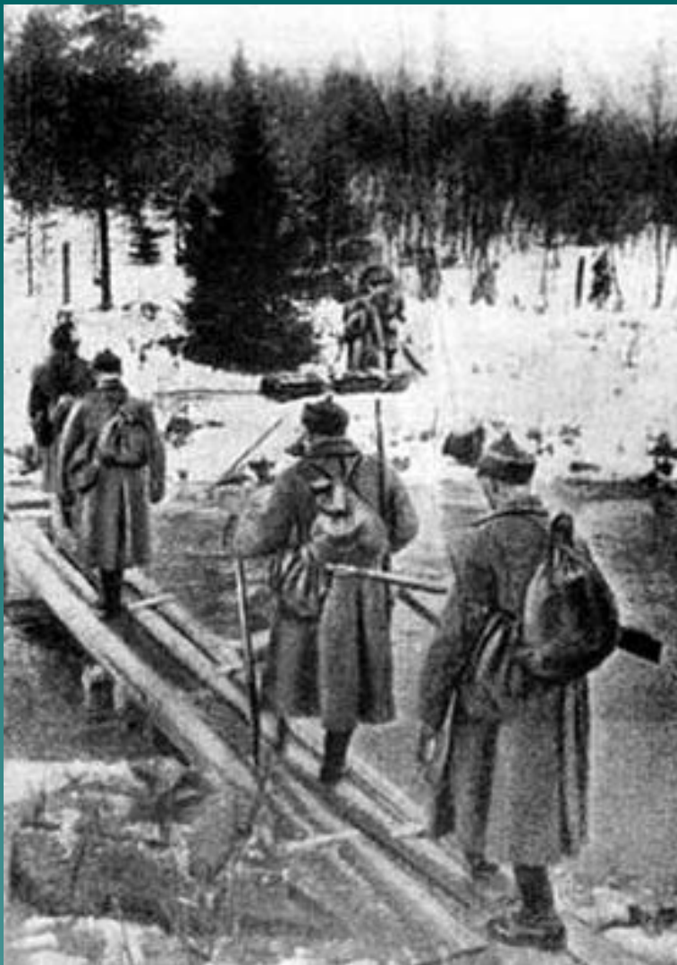
Бойцы РККА переходят пограничную реку Раяйоки. 30 ноября 1939 года