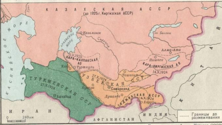
II. НАЦИОНАЛЬНО-ГОСУДАРСТВЕННОЕ РАЗМЕЖЕВАНИЕ РЕСПУБЛИК СРЕДНЕЙ АЗИИ (1924 - 1925 гг.)

Республики, находившиеся в союзных отношениях с РСФСР I Хорезмская нар. сов. респ. 26.IV.1920 г. II Бухарская нар. сов. респ. 6.X.1920 г. Границы СССР на 30.XII.1922 г.