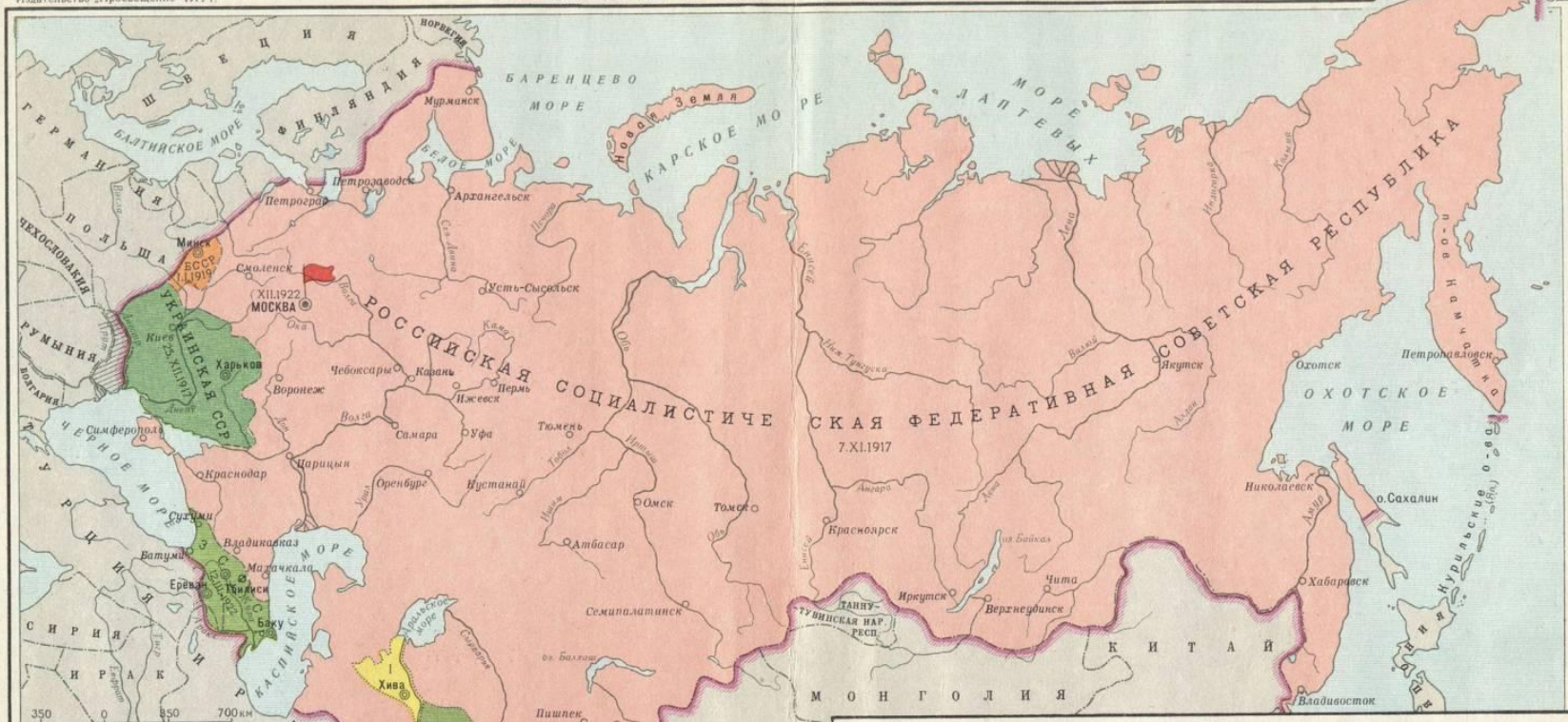
I. СЕВЕРНЫЙ КAVКАЗ И ЗАКАВКАЗСКАЯ СОЦИАЛИСТИЧЕСКАЯ ФЕДЕРАТИВНАЯ СОВЕТСКАЯ РЕСПУБЛИКА