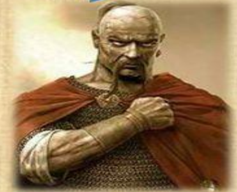
Князь Святослав (957-972 гг.)

Установление и поддержание порядка в государстве, укрепление дипломатических связей с Византией