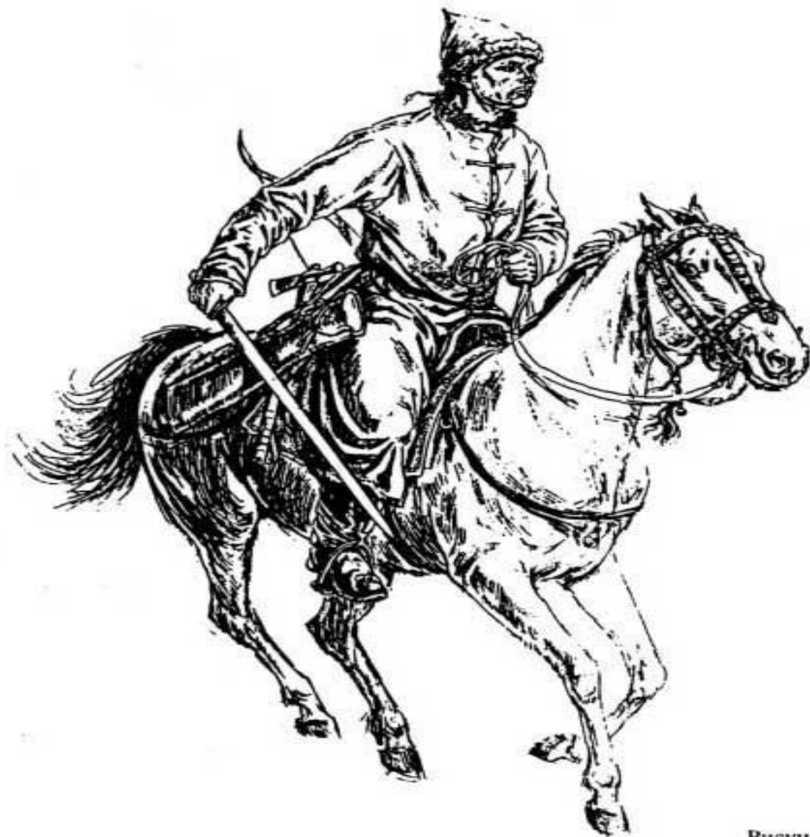
Рисунок О. Федорова