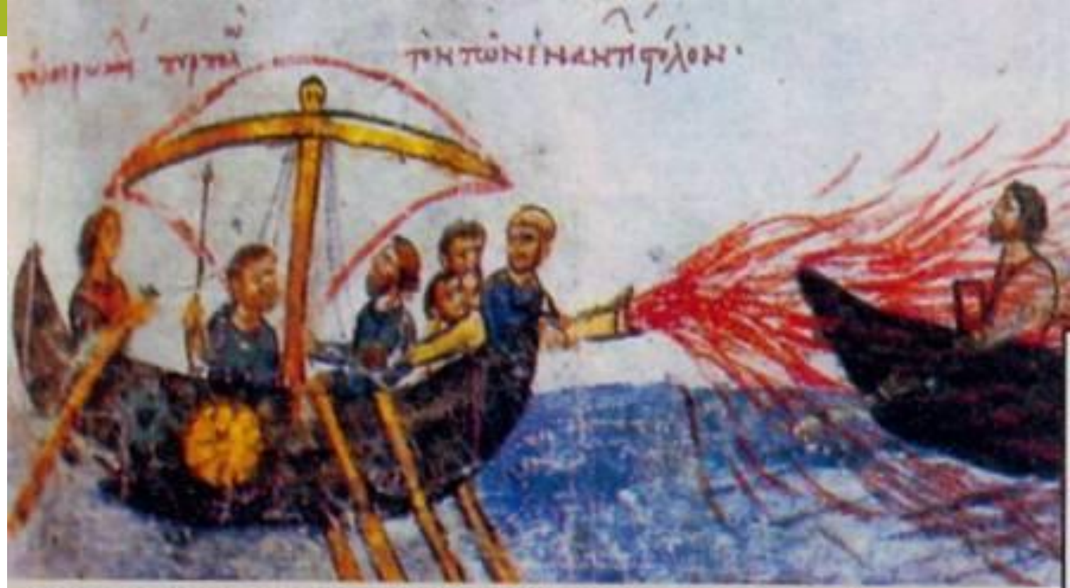
Применение «греческого огня» византийцами. Миниатюра из летописи

• В 941 году Игорь пошёл морем к берегам Византии. Болгары дали весть в Царьград, что идет Русь; выслан был против нее Феофан, который пожег Игоревы лодки греческим огнем. Потерпев поражение на море, руссы высадились в Малой Азии.