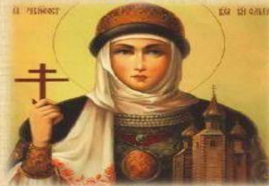
Княгиня Ольга (945-957 гг.)

Заключение союза с Печенегами, возвращение под власть Киева древлян, обложение из данью.