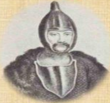
Князь Игорь (991-945 гг.)

Объединение Киева и Новгорода (882 г.), подписание договоров с Византией 907, 911г., объединение восточно- славянских племен