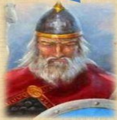
Князь Олег (882-912 гг.)

Объединение Киева и Новгорода (882 г.), подписание договоров с Византией 907, 911г., объединение восточно- славянских племен