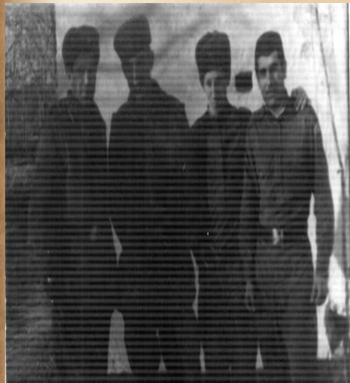
С боевыми товарищами