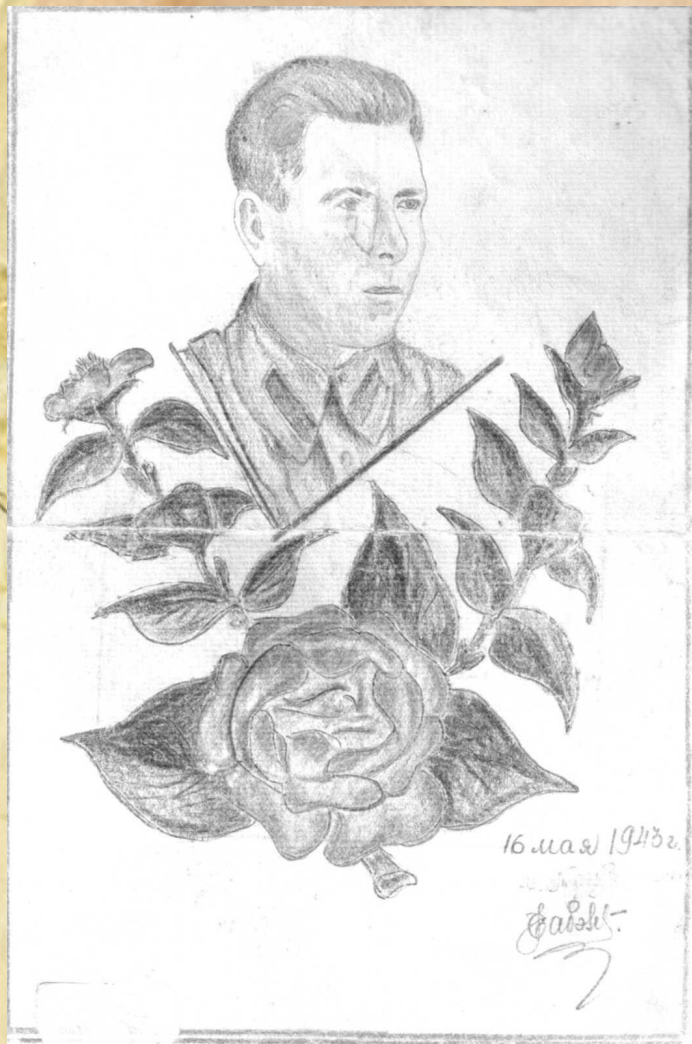
Подарок фронтового друга