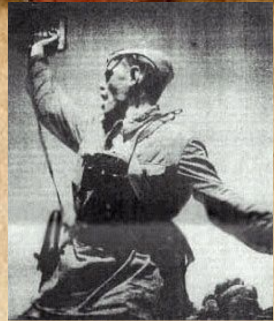
«За Родину!» Командир Красной Армии поднимает бойцов в атаку

В результате контрнаступления Красной Армии под Москвой в декабре 1941 года немцы были отброшены. Московская битва была началом коренного поворота в войне. Ленинград, находящийся в блокаде, мужественно держался — несмотря на то, что самой страшной блокадной зимой 1941-42 гг. от голода и холода погибли сотни тысяч мирных ленинградцев.