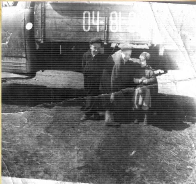
Вот оно военное детство...