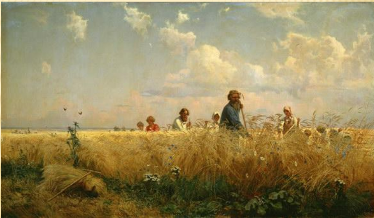
СТРАДНАЯ ПОРА. (КОСЦЫ), Григорий Мясоедов, 1887г.

«Труд – целесообразная деятельность человека, направленная на создание с помощью орудий производства материальных и духовных ценностей» (Толковый Словарь Ожегова).