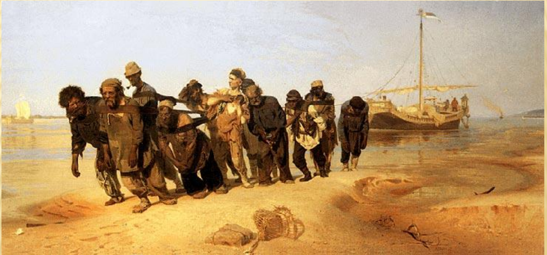
И.Репин. Бурлаки на Волге. 1870-1873. Холст, масло.