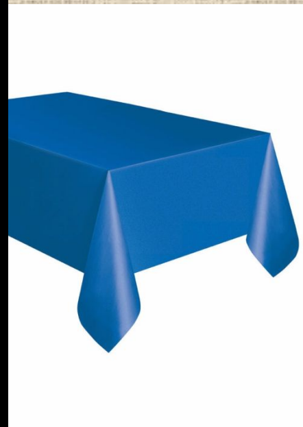
Кле енко й