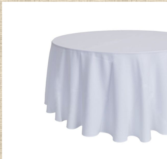
Ск атерть ю