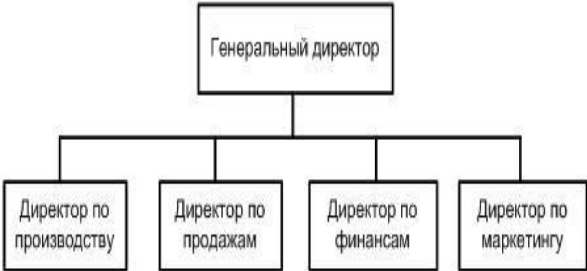
СХЕМА ФУНКЦИОНАЛЬНОЙ СТРУКТУРЫ