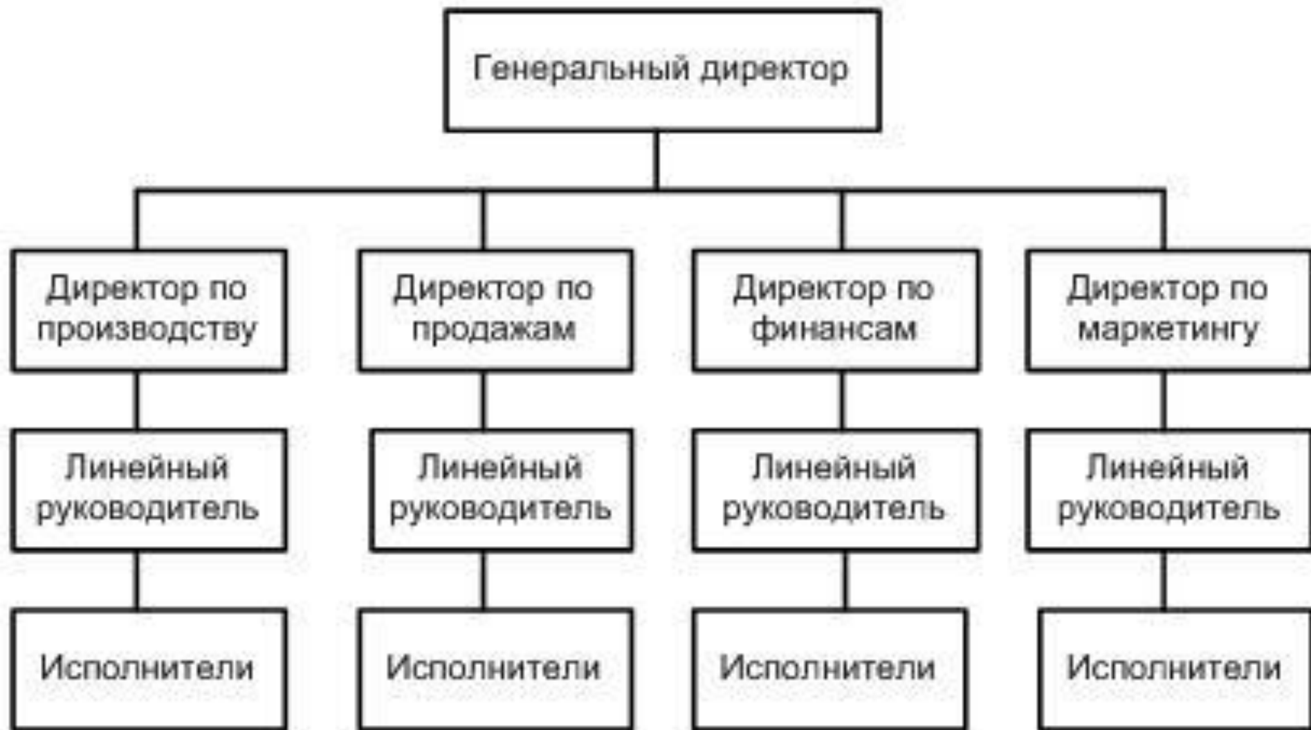
СХЕМА ЛИНЕЙНО- ФУНКЦИОНАЛЬНОЙ СТРУКТУРЫ