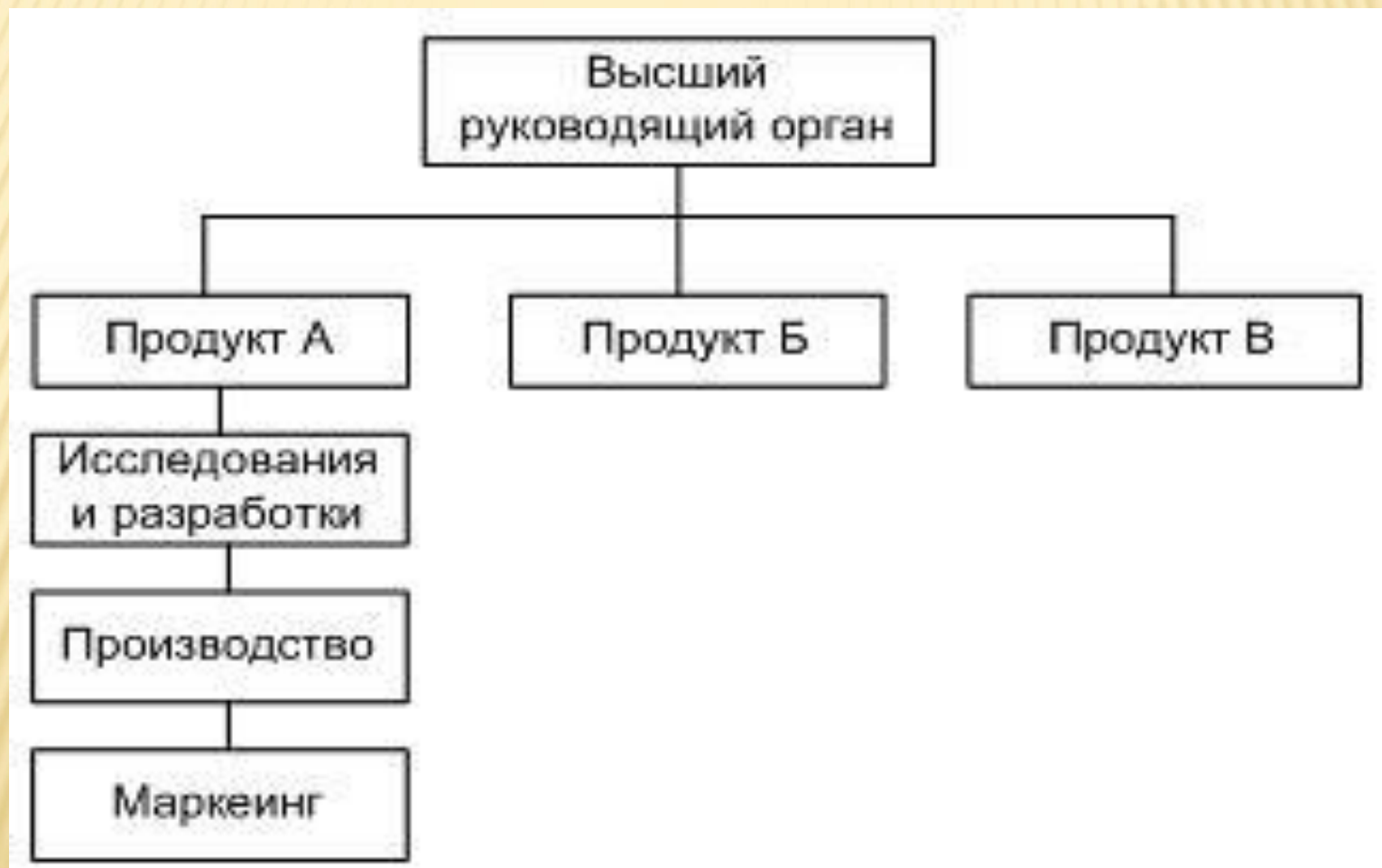
Схема дивизиональной структуры управления