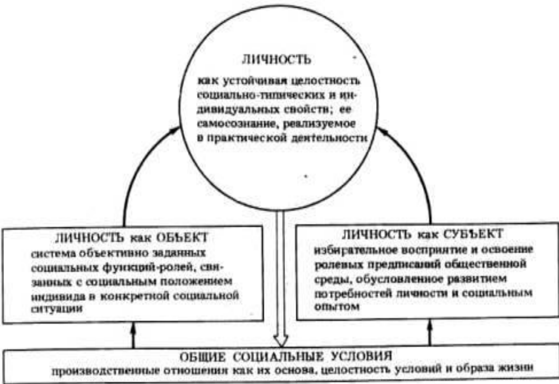
Р и с. 2а. Личность как объект и субъект социальных отношений