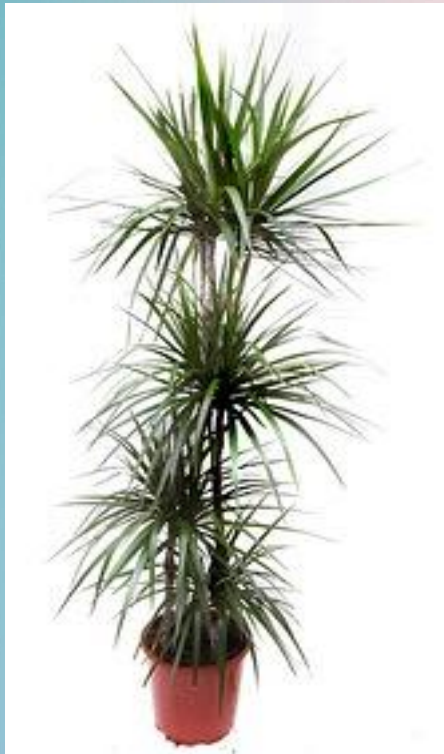
Драцена ( Dracaena )