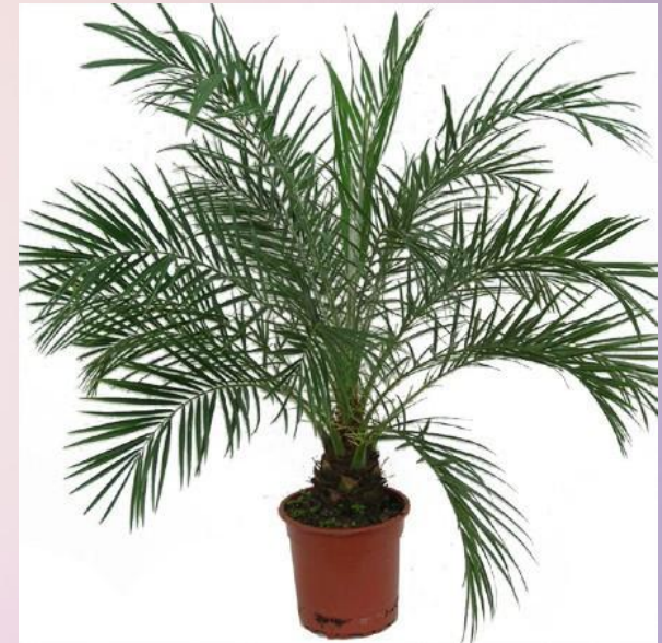
Карликовая финиковая пальма ( Phoenix roebelenii )