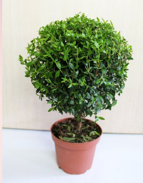
Мирт ( Myrtus )