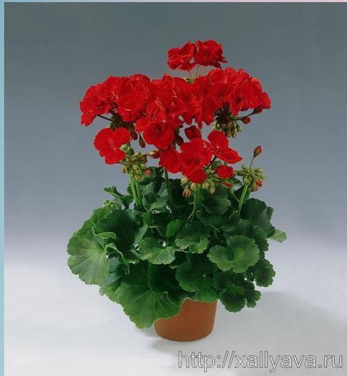
Герань ( Geranium )

(Уменьшают содержание микробов в воздухе помещений)