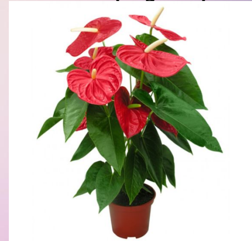
Антуриум ( Anthurium ) 70%