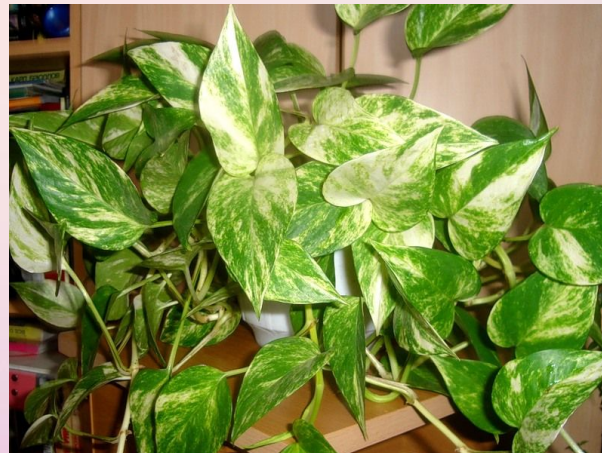
Сциндапсус ( Scindapsus )