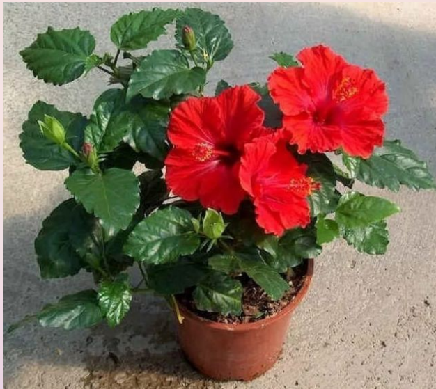
Гибискус ( Hibiscus )