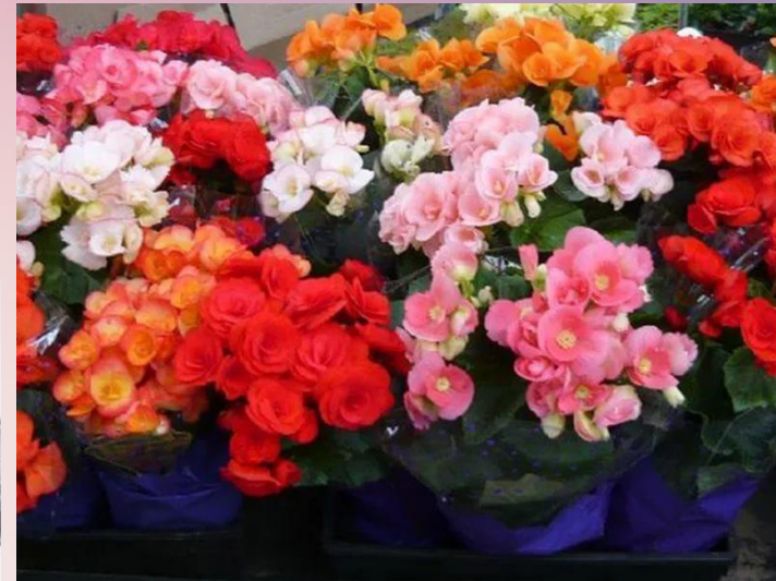
Бегония ( Begonia ) 80%: