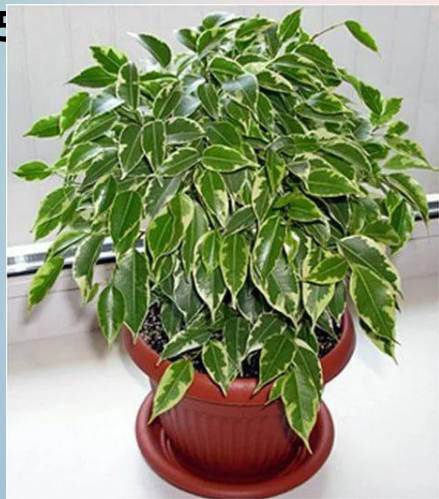
Фикус ( Ficus ) 30%