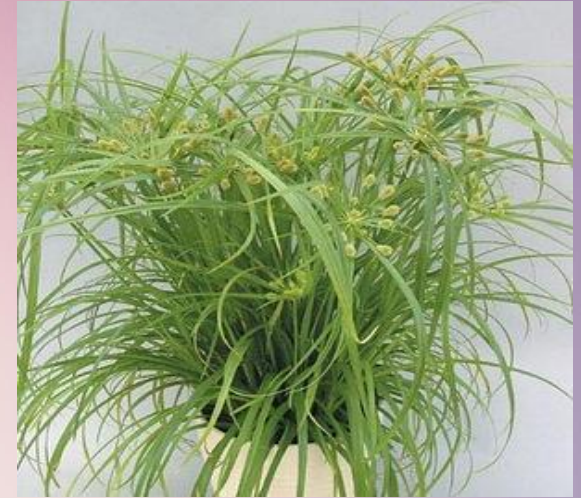
Циперпс ( Cyperus )