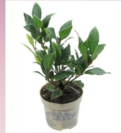
Лавр ( Laurus )