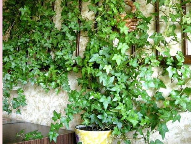
Плющ ( Hedera helix )