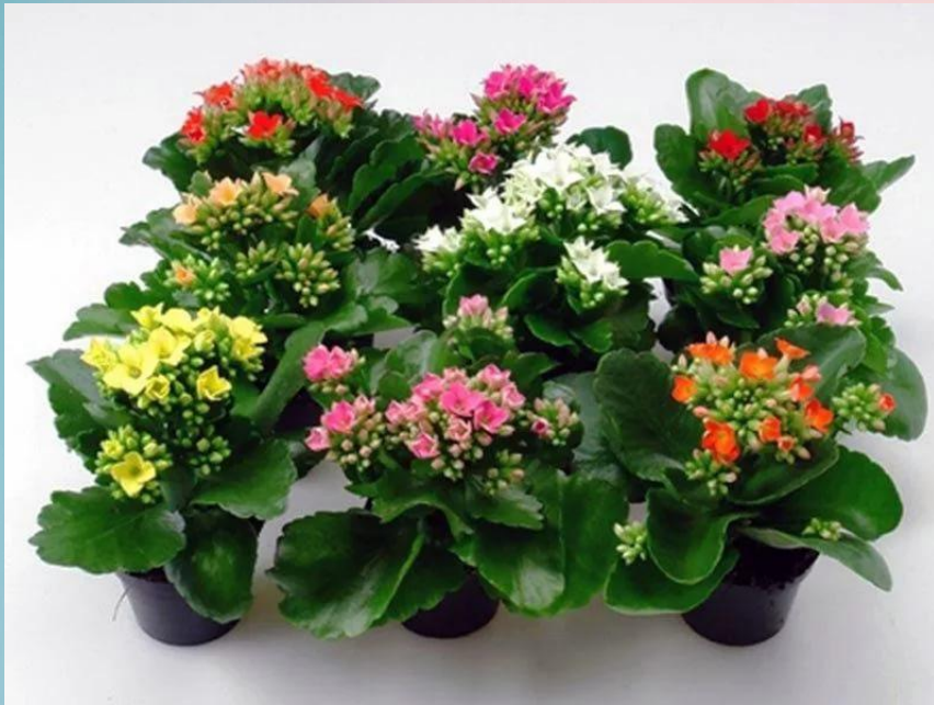
Каланхое ( Kalanchoe Adans )

Проявляют противовоспалительные, бактерицидные, ранозаживляющие