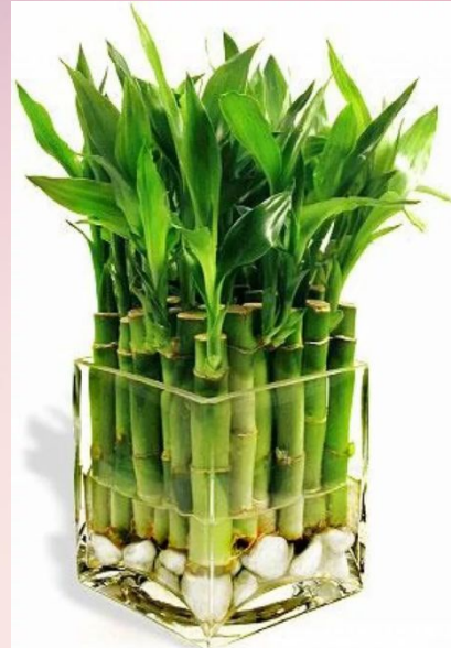
Бамбук ( Bambusa )