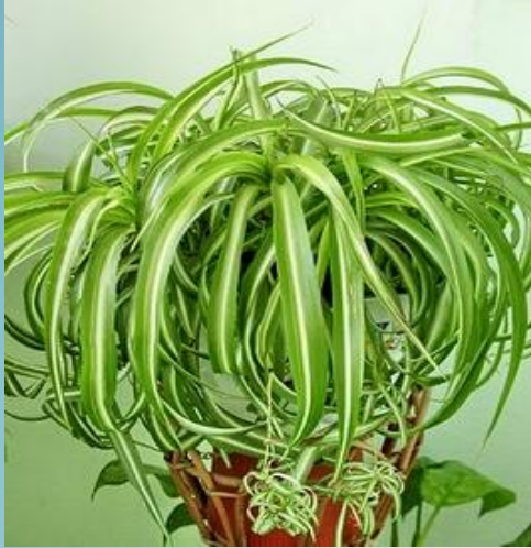
Хлорофитум ( Chlorophytum )