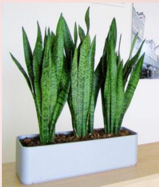
Сансевиера ( Sansevieria )