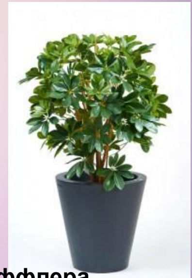
Шеффлера ВОСЬМИЛИСТНАЯ ( Schefflera octophyll )