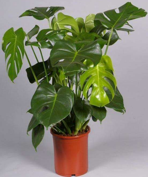
Монстера ( Monstera )