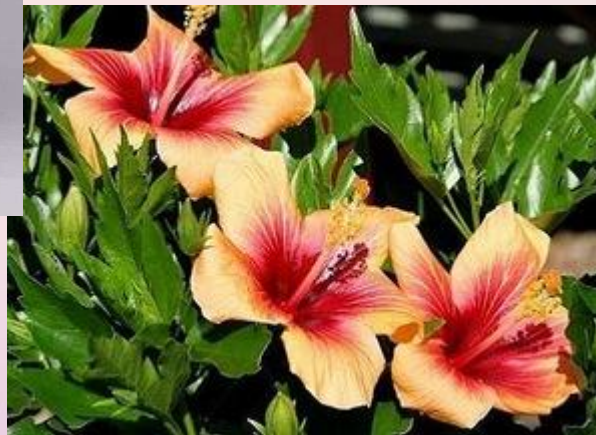
Китайская роза ( Hibiscus rosa-sinensis )