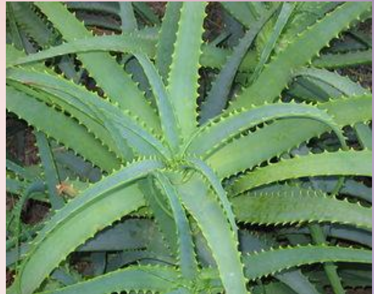
Алое ( Aloe )