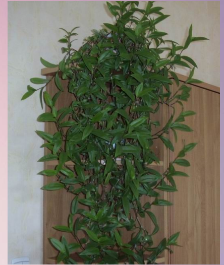
Традесканция ( Trad )