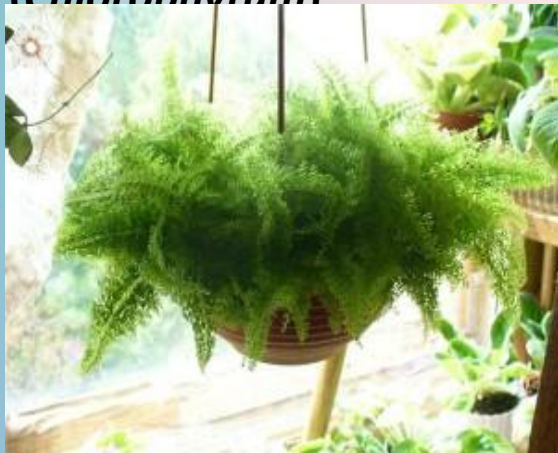
Нефролепис ( Neprolepis )