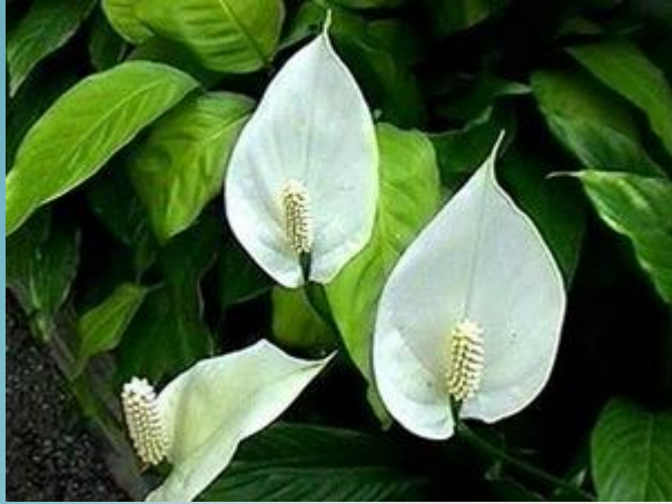
Спатифиллум ( Spathiphyllum )