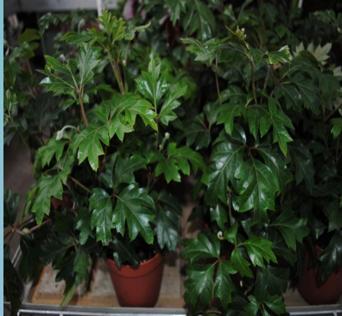
Циссус ( Cissus )