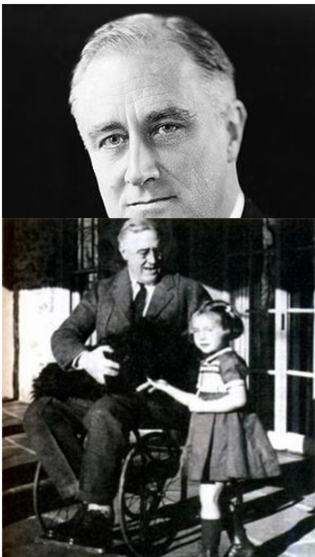
Франклин Делано РУЗВЕЛЬ Т (1882 – 1945)