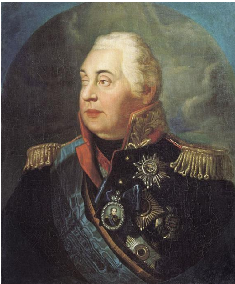
Михаил Илларионов ич КУТУЗОВ (1745 – 1813)

Прославленный русский полководец. Участник штурма Измаила (1790 год). Русский главнокомандующий в Отечественной войне 1812 года (разгром непобедимого прежде Наполеона и изгнание его из России).