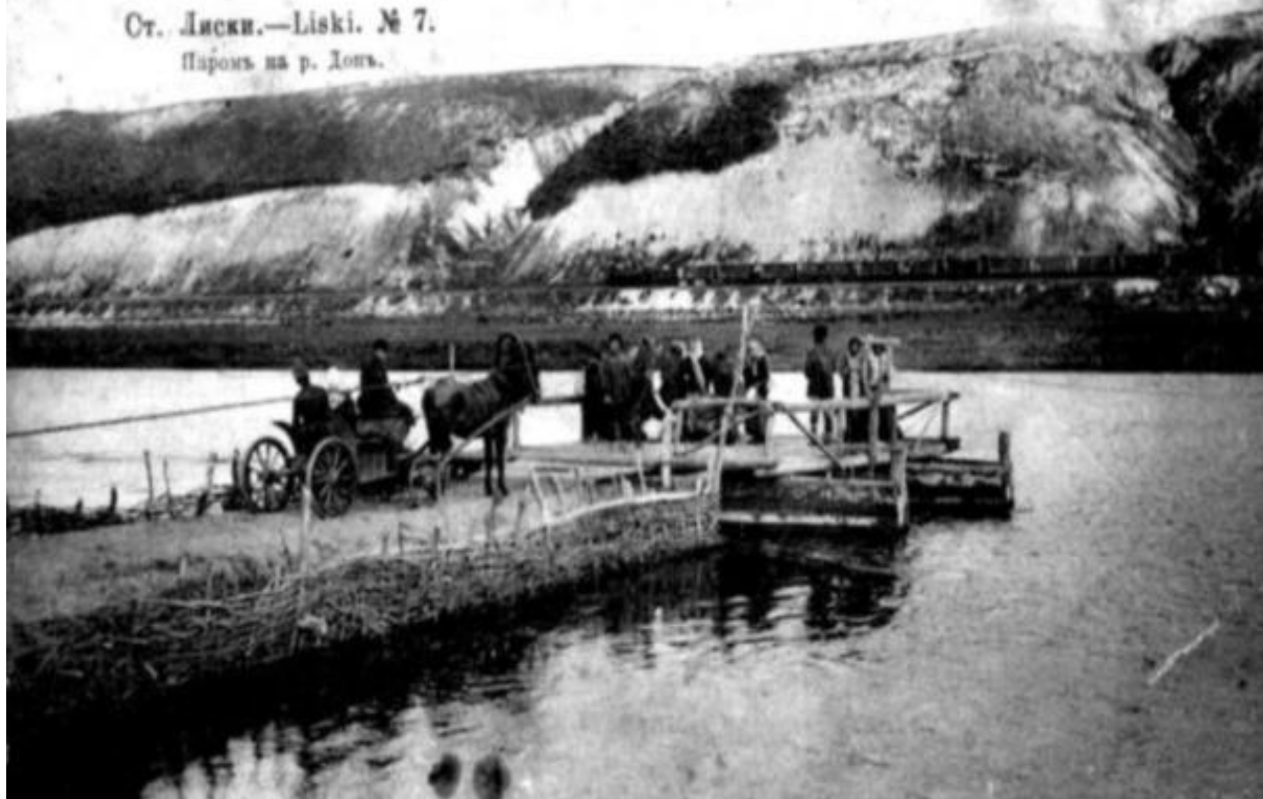
Ст. Лиски.—Liski. № 7. Паромъ на р. Донъ.