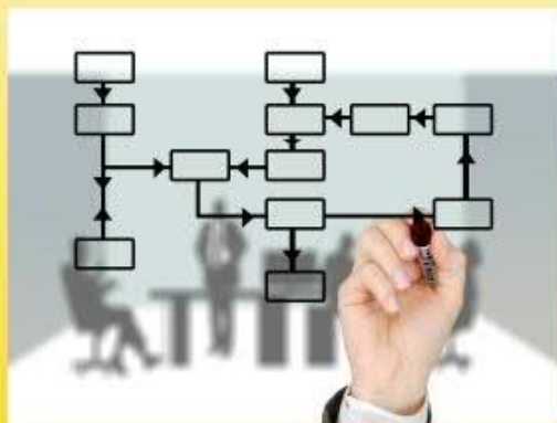
Описание бизнеса и организационный план

Анастасия Булычева (VitaConsultingGroup)