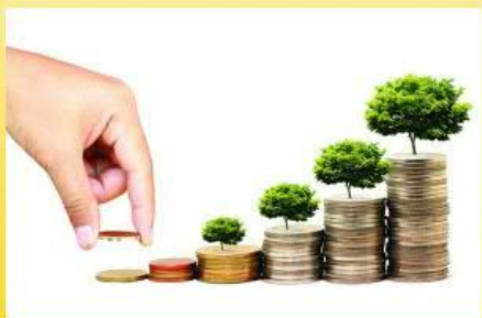
Финансовый план проекта

Анастасия Булычева (VitaConsultingGroup)