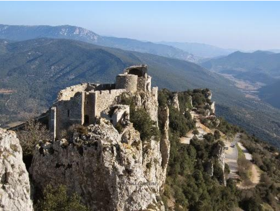
Вверху и справа – руины замков Южной Франции

В горных районах замки возводили на неприступных скалах.