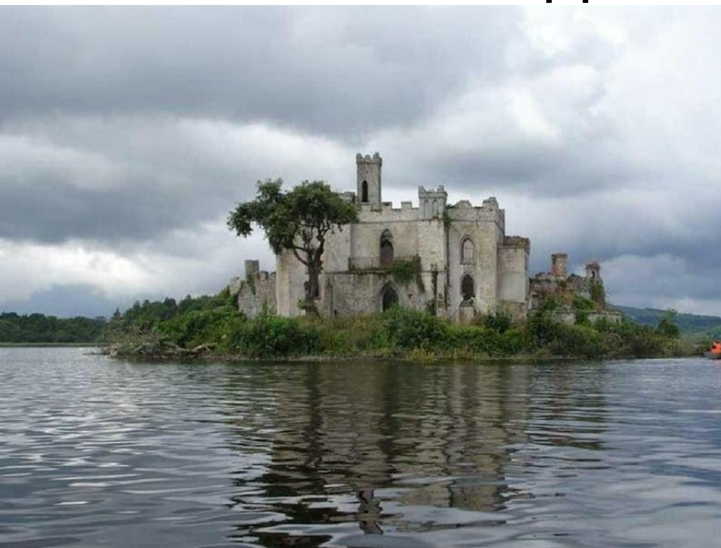
Замок Макдермотт на оз. Лох Ке. Графство Роскоммон, Ирландия