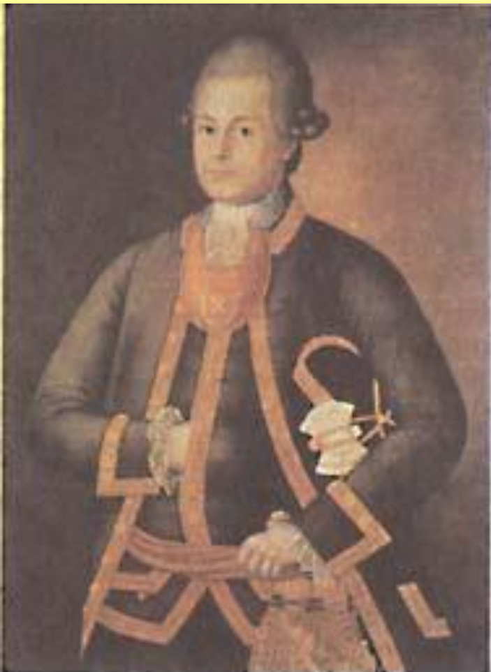
Офицер лейб-гвардии Измайловского полка. 1744 г.

Разрешив помещикам оставаться в имениях, государство заботилось не только о повышении их благосостояния, но и росте казенных доходов, ведь без хозяйского надзора имения разорялись, что вело к росту недоимок.