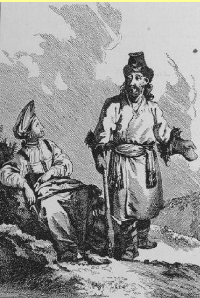
Крестьянская чета XVIII в.