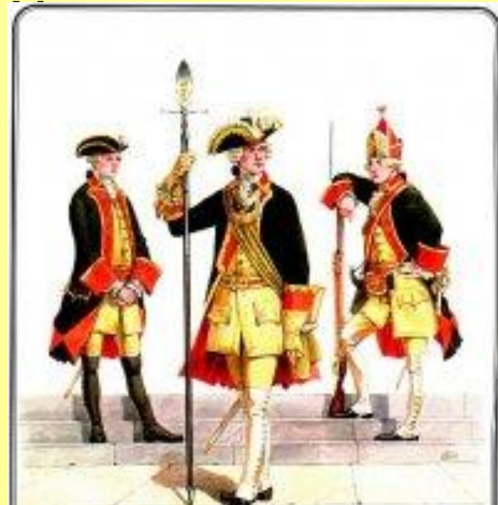
Кадеты: фузилер, офицер и гренадер.

Таким образом, у дворян появилась возможность избавиться от ненавистной службы рядовыми наряду с лицами «подлых» сословий. В Корпусе обучали не только военному делу, но и основам наук.