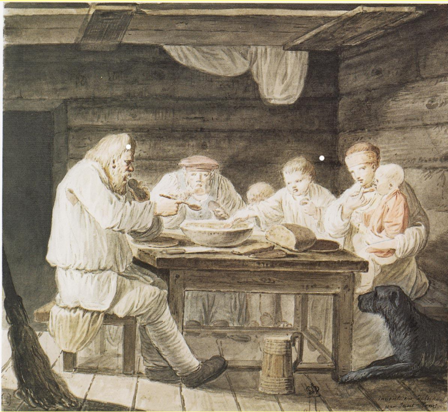
Крестьяне за обедом. Худ. И.А. Ерменев. 1764–1765.

Чем больше льгот получало дворянство, тем сильнее становилась его власть над крестьянством.