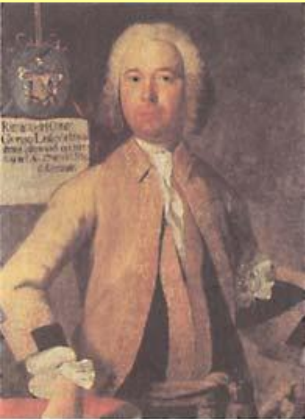
Секунд-майор кирасирского полка. 1749 г.

В 1739 г., по окончании войны, ходатайства об отставке подала почти половина офицеров, в т.ч. многие, не достигшие 45 лет.