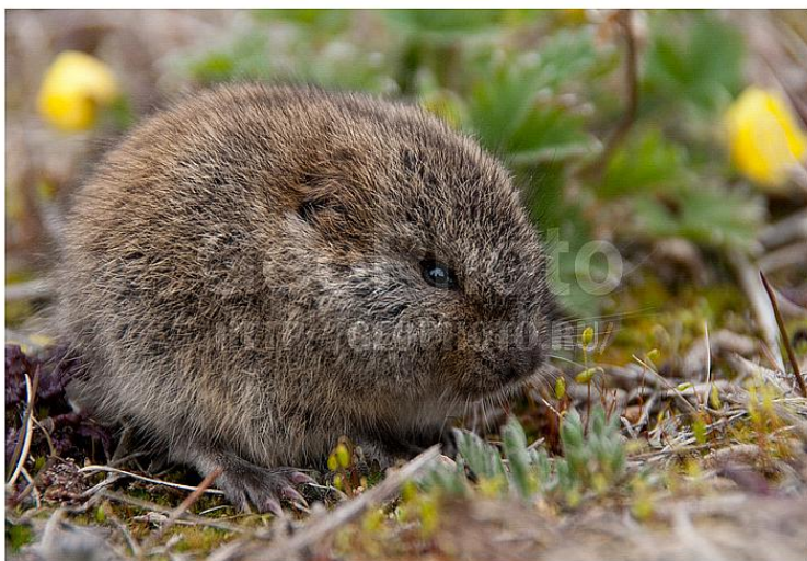
# b2r00014 Krangel Island, Russia

Мелкий короткохвостый грызун: длина тела 12,1-18 см, хвоста — 11-17 мм. Весит от 45 до 130 г; Общий тон окраски рыжевато-жёлтый с примесью серого и буроватого тонов. Зимний мех светлее и тусклее летнего, иногда почти белый, со светло-коричневой полоской на спине.