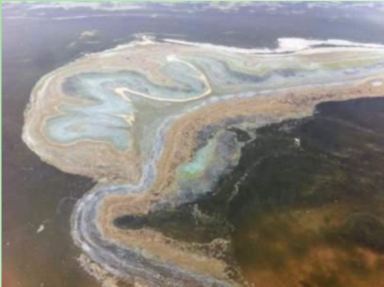
Загрязнение в местах неорганизованного туризма