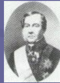
С.С. Ланской (1855-1861)