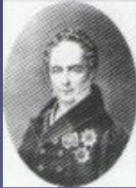
В.П. Кочубей (1802-1807, 1819-1823)