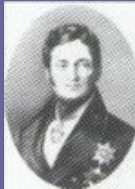
Л.А. Перовский (1841-1852)