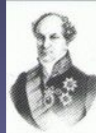
А.Н. Голицин (1819)