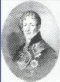
Б.Б. Кампенгаузен (1823)