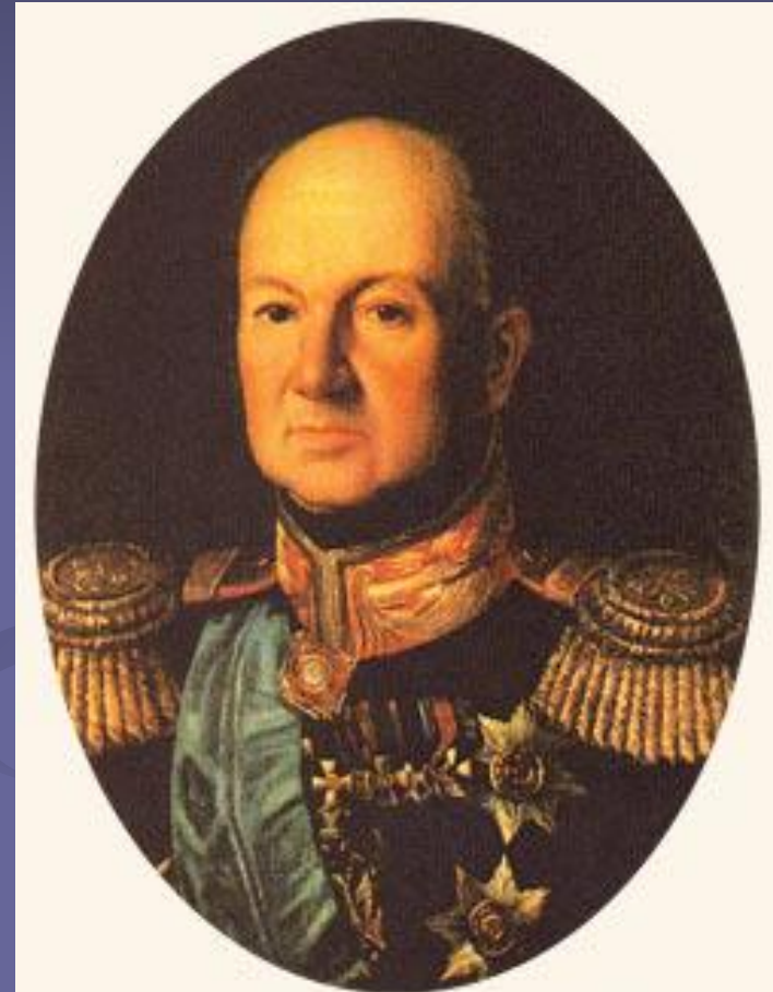
граф А. А. Закревский

Попытка А. А. Закревского в 1828 году, ставшего в том же году министром внутренних дел , создать секретную политическую полицию в системе вверенного ему учреждения потерпела неудачу, во многом благодаря противодействию со стороны руководства III Отделения.