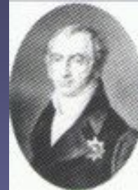
О.П. Козодавлев (1810-1819)