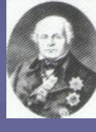
Д.Н. Блудов (1832-1839)