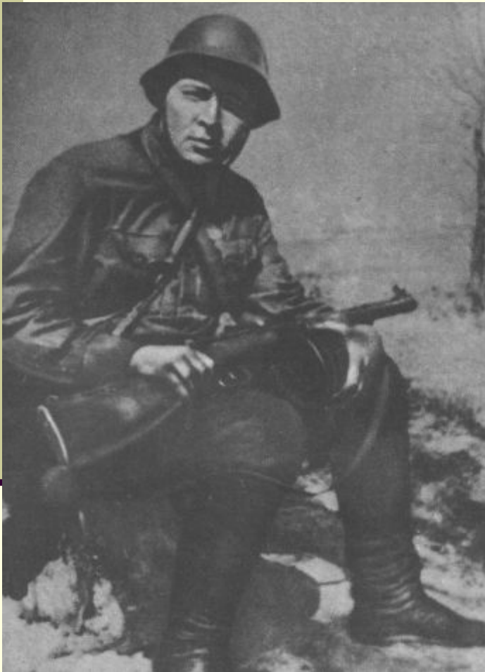
А.Гайдар на фронте. 1941 г.