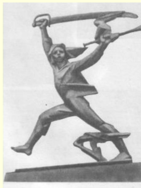
Скульптура Мальчиша-Кибальчиша в Москве на Ленинских горах.