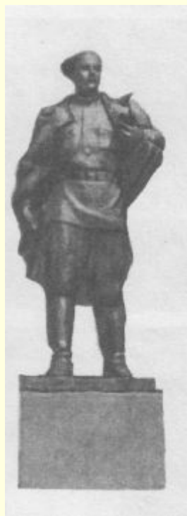
В городе Льгове.