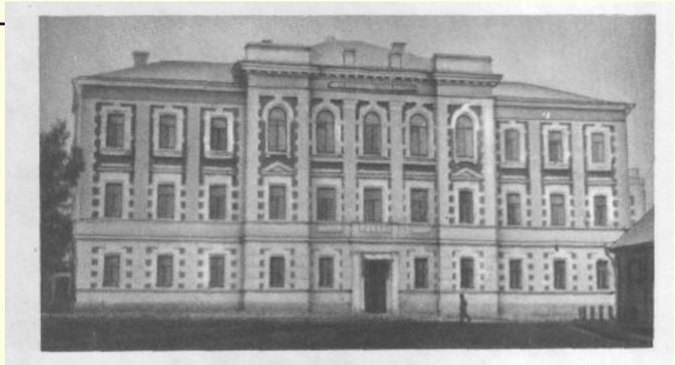
Город Арзамас. Реальное училище, в котором с 1914 по 1918 год учился А. Голиков (Гайдар).