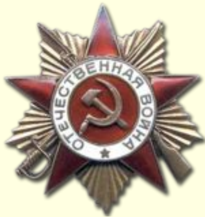
Орден Отёческой войнЫ — военный орден СССР