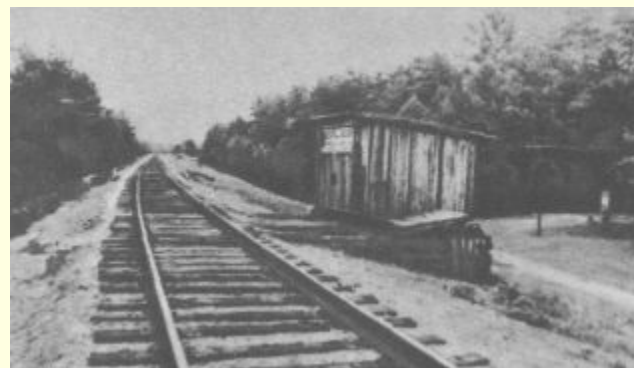
Место гибели А.Гайдара.