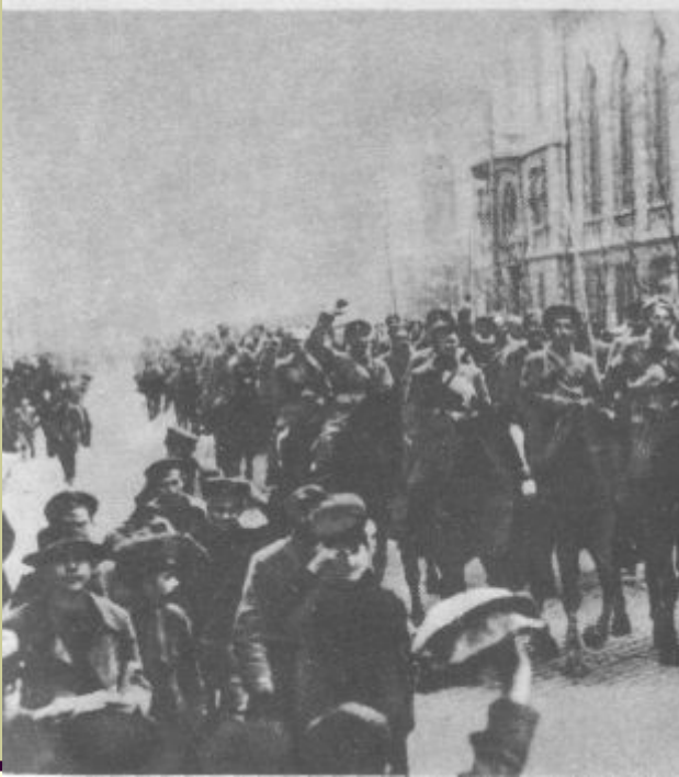
На улицах города.