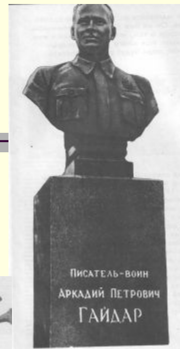
В городе Каневе на могиле писателя.