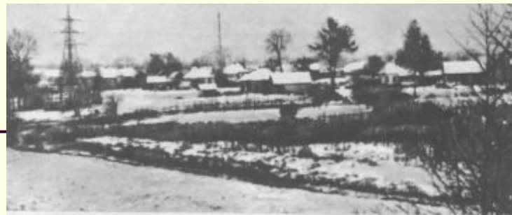
Село Леплява Каневского района под Киевом, возле которого погиб А.Гайдар.

■ А.Гайдар, защищавший Родину, погиб, чтобы ценой своей жизни спасти товарищей.