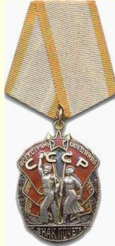
Знак Почёта — государственная награда СССР