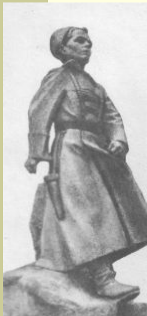
В городе Арзамасе.