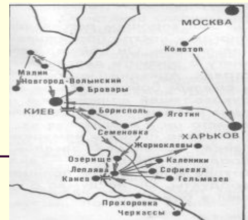
Карта боевых дорог А.Гайдара.