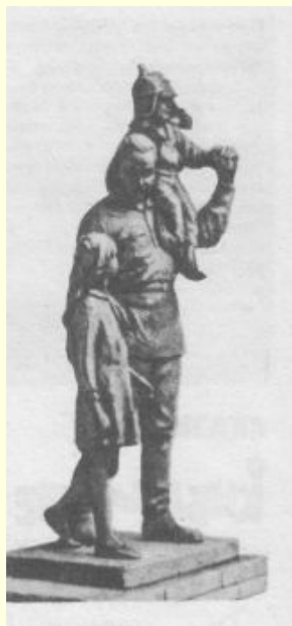
Скульптурная группа «Гайдар с детьми»