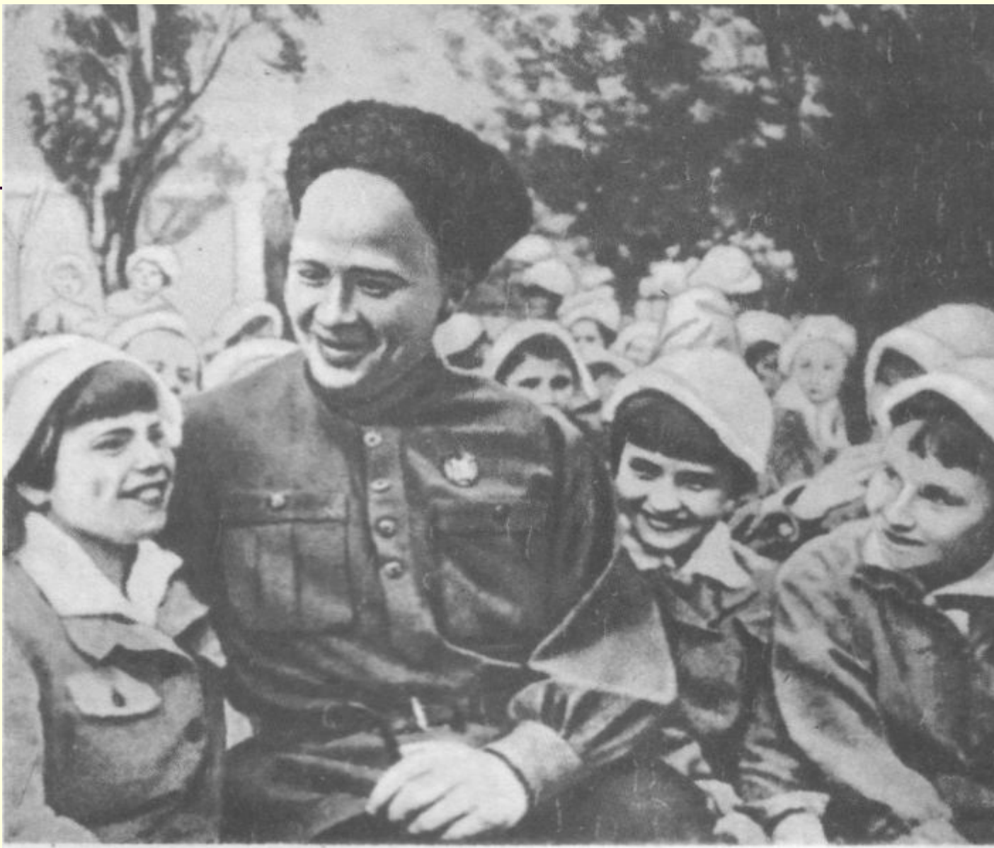
Аркадий Гайдар с пионерами. 1939 г.