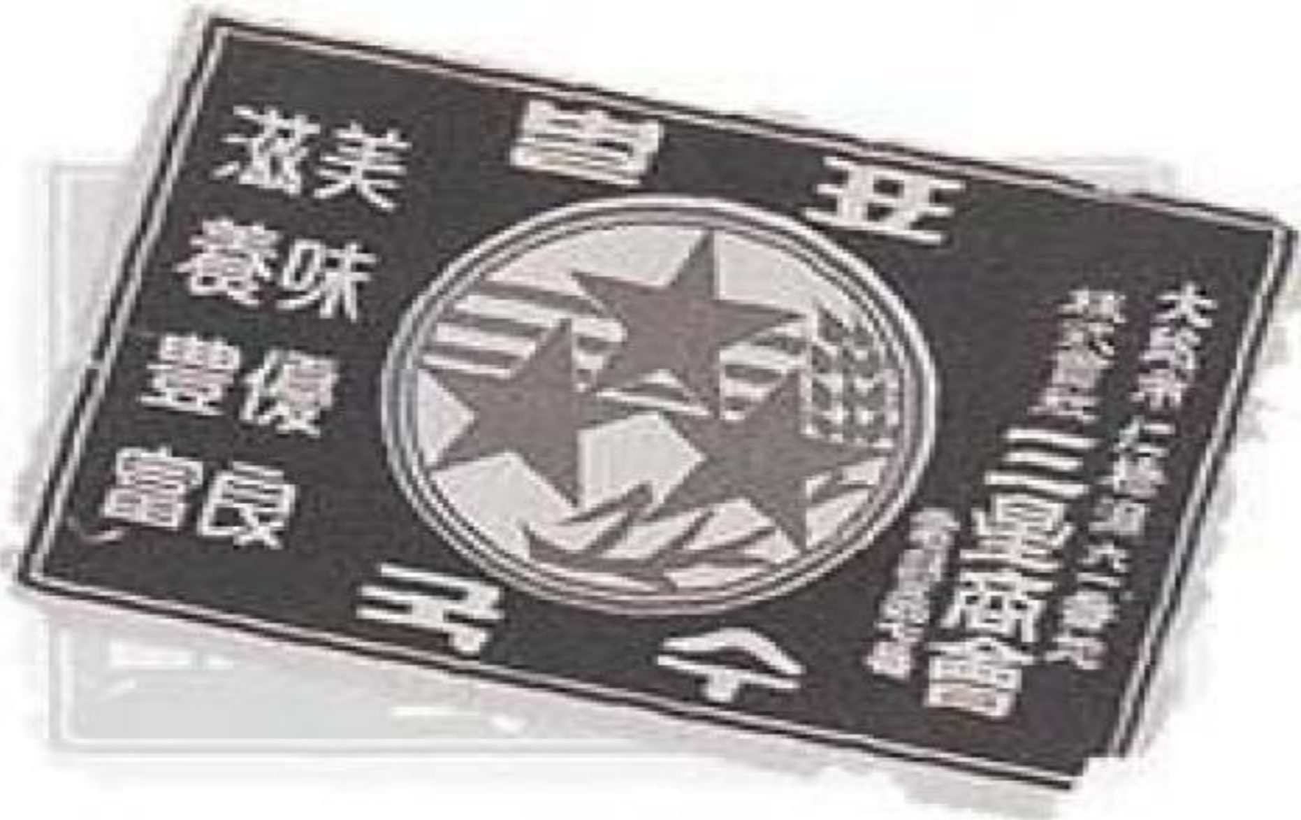
Логотип компании Samsung Byeolpyo, производившей макаронные изделия (1938-1958)