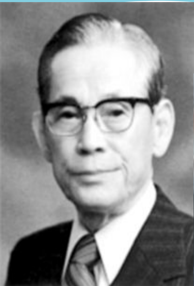
Ли Бён Чхоль