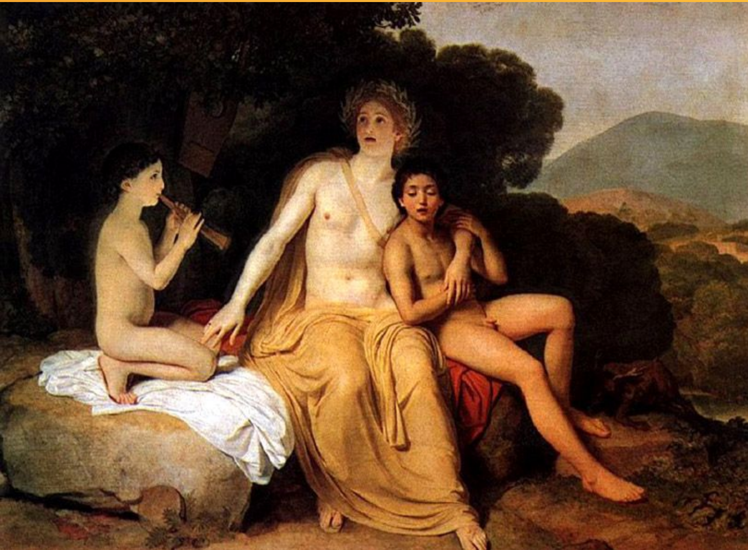
"Аполлон, Гиацинт и Кипарис, занимающиеся музыкой и пением" (1831-1834)

В Италии он изучает античные памятники, знакомится с искусством Ренессанса, восхищается венецианскими фресками.