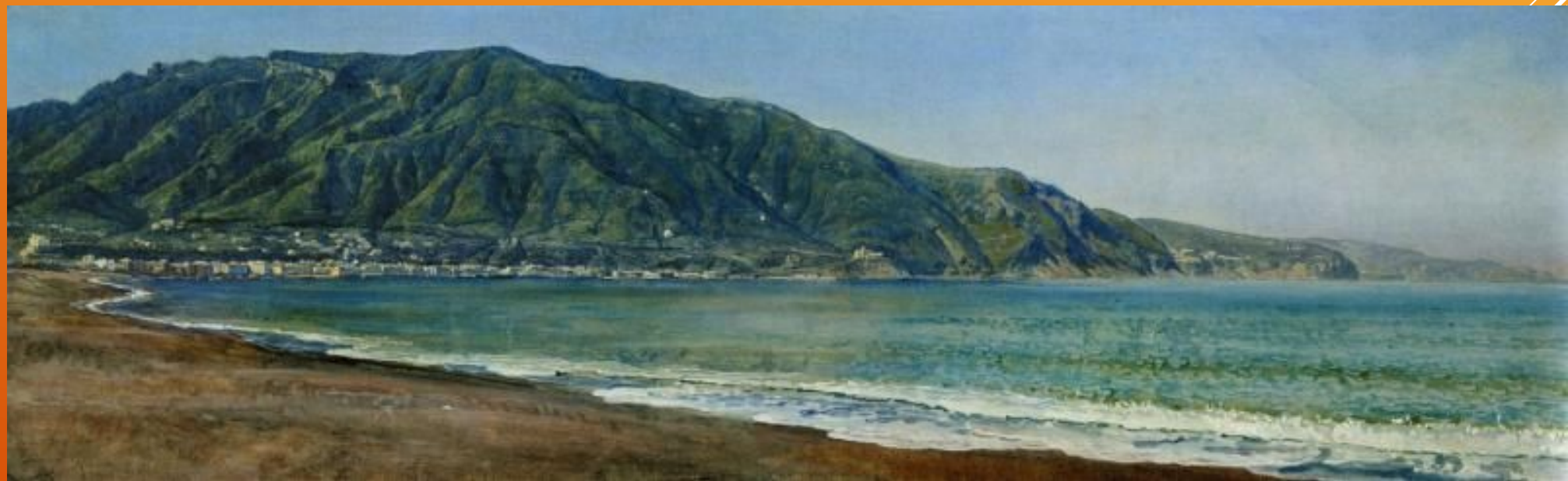
"Неаполитанский залив у Castellammare"