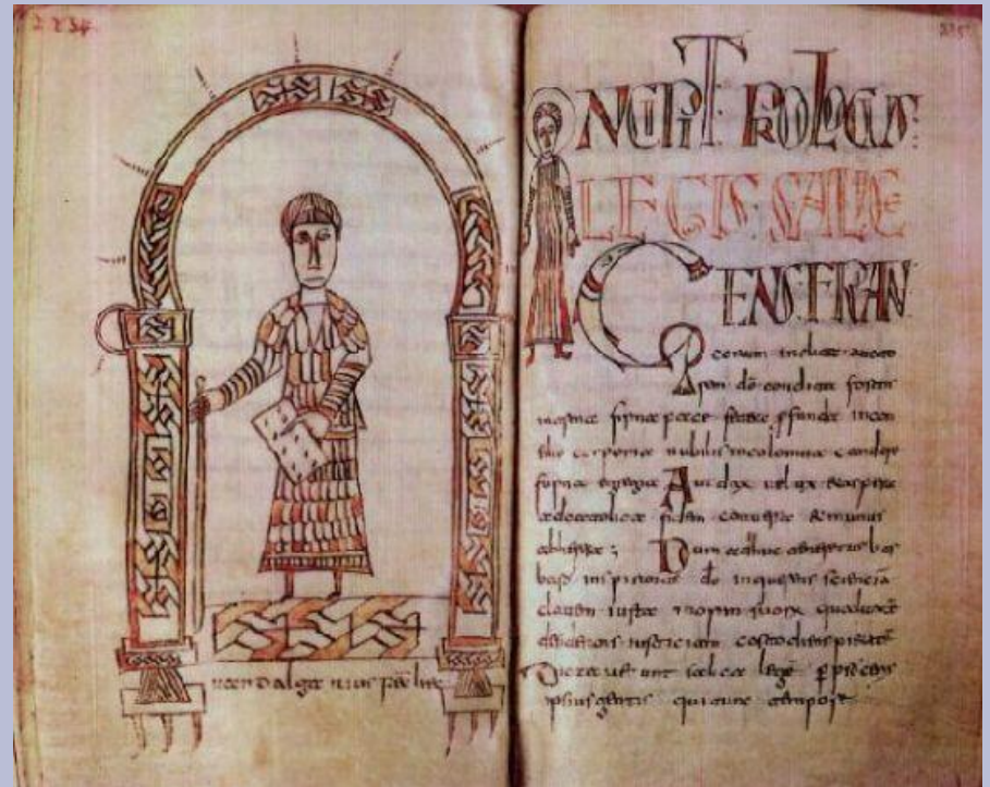
«Салическая правда» франков

ВАРВАРСКИЕ ПРАВДЫ (лат. Leges barbarorum , букв. – законы варваров) - принятое в отечественной литературе название раннефеодальных юридических законов, в которых были записаны правовые обычаи, устоявшиеся образцы судебных решений.