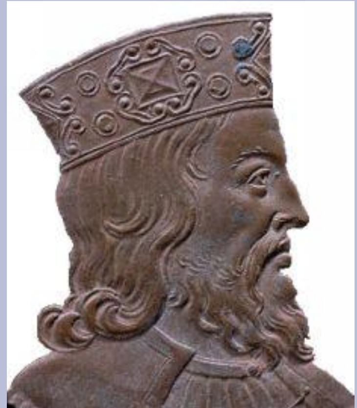
Изображение Хлодвига – короля франков